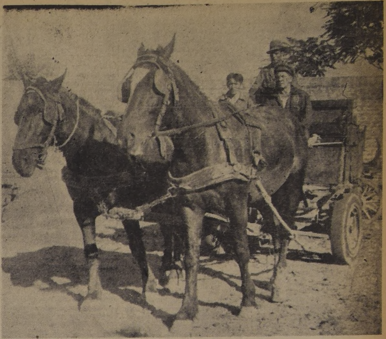
Un destartado carretón municipal de aseo, en los momentos en que sale de la I Zona, ubicada en Echeverría esquina de la Avenida de La Paz. Obsérvese el pésimo estado del vehículo. En esta Zona hay ciento veinte caballos, la mayoría de los cuales sufren maltrato.

En espera del Ministerio se adelantó que habrá fallo en este conflicto pasado mañana. La demora en la constitución