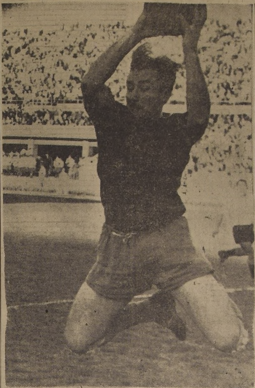
EL UNICO ARQUERO.—Sergio Livingstone, el popular "Sapo", fue el unico arquero de los llamados a la preseleccion que concu rrió a la práctica de ayer. Y se vio bastante bien.

¿VAMOS NO SEAS VAGABUNDO DE MAL AGUSTO? ES JUSTO QUE ME ASCENDAN A SE CRETARIO DEL GERENTE DESPUES DE CUATRO AÑOS DE ESPERANZA. ¿GOSTA PERSONA PESO NO HAY JUSTICIA QUE VALGA SI NO CONSULTAS AL DEN TISTA-SOBRE TU ALIENTO, LOS JEFES SIEMPRE MIRAN ESE MALAJE. ELLA CONSULTO AL DENTISTA DEBA BUBIAR UNA DE LAS POSIBLES CAUSAS DEL MAL ALIENTO, CEPILARSE LOS DIENTES TRES VECES AL DIA CON CREMA DENTIFRICA COLGATE. GRACIAS DOCTOR! DESDE HOY SEGUIRE SU CONSEJO. ¿DESPUES DE LAVARSE LOS DIENTES, DISUELVEN EN SU BOCA UN POCO DE LA MISMA CREMA DENTIFRICA CON LA SOPRO DE AGUA Y SI HAY BUCHOS, LUEGO ENJUAGUENSE NOTARA ASI SU BOCA REALMENTE LIMPIA Y FRESCA. QUE MARAVILLA! LA ESPUMA ACTIVA Y PENETRANTE DE CREMA DENTIFRICA COLGATE SE INTRODUCE ENTRE DIENTE Y DIENTE CON LA AYUDA DEL CEPILLO EMPANANDO A FONDO, ELIMINA ASI UNA DE LAS CAUSAS DEL MAL ALIENTO. CREMA DENTIFRICA COLGATE MANTIENE EL ALIENTO PURO, PERMUTANDO Y MISTIENDO DIENTES BLANCOS Y BRILLANTES! USE HOY MISMO CREMA DENTIFRICA COLGATE RECURRENTE. Crema Dentifrica Colgate perfume «aliento limpio» embellece sus dientes! LA FELICITACION SE DORA DESDE EL PROXIMO MES EN LA SECRETARIA DEL GERENTE.