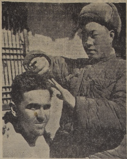
PRISIONERO NORTEAMERICANO DE LOS NORCOREANOS.— COREA DEL NORTE.— Un miembro del cuerpo de voluntarios del pueblo de la China hace las veces de barbero en un campo de prisioneros del norte de Corea. Un prisionero norteamericano identificado es atendido por el improvisado peluquero. La fotografía y la lectura son de fuente comunista china.

TOKIO, 8 (UP).— El Primer Ministro, Shigeru Yoshida, en el primer día que concurre a su despacho, este año, apartó hoy a Japón un importante trecho de la China roja, acercándose a la China nacionalista.