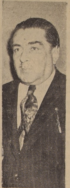
JUAN PRADENAS MUÑOZ. — Nació en Talcahuano en 1890. Ingresó sus actividades en ese mismo puerto, donde publicó el periódico "Adelante". Organizó el primer Congreso Minero en 1920. Fue diputado por Coronel en 1921, por Antofagasta en 1930, senador desde 1932 hasta 1940, por Tarapacá y Antofagasta. Ministro del Trabajo y Antofagasta. Ministro del Trabajo en 1940, y delegado de Chile ante la Conferencia Interamericana del Trabajo en Canadá, en 1941, puesto que renunció en 1942. Ocupa actualmente el cargo de Consultor de Chile en Los Angeles, cargo que dejó circunstancialmente en 1947.