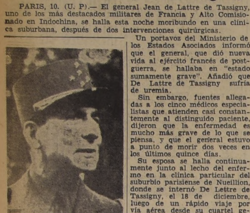
General de Latre de Tassigny, que se encuentra moribundo en una clínica de los suburbios de París, después de las intervenciones quirúrgicas a que fue sometido.

PARIS, 10. (U. P.).—El general Jean de Latre de Tassigny, uno de los más destacados militares de Francia y Alto Comisionado en Indochina, se halla esta noche moribundo en una clínica suburbana, después de dos intervenciones quirúrgicas.