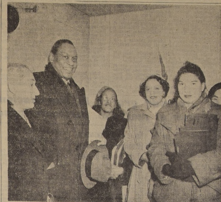
PAUL ROBESON CLAMA POR LOS NEGROS EN LA NU. — El gran cantante norteamericano, y una delegación, llegaron hasta las oficinas de la NU en N. York, protestando contra el Gobierno de su país y acusándolo de "maltratar a los negros".