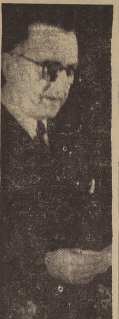
JUVENAL HERNANDEZ JAQUE. — Nació el 6 de septiembre de 1899. Se tituló de abogado en 1924. Fue profesor de Derecho Romano y Civil, en la Escuela de Derecho de la Universidad de Chile. Decano de la Facultad de Leyes, y desde 1932. Rector de la misma Universidad. Fue Ministro de Defensa Nacional, desde 1940 hasta el 42, y ocupó el mismo cargo en abril de 1947. Presidió la delegación chilena a la Conferencia de Bogotá en 1948. Ha militado desde joven en el Partido Radical, en donde ha ocupado jerarquías que lo han llevado hasta la postulación a la Presidencia de la República.