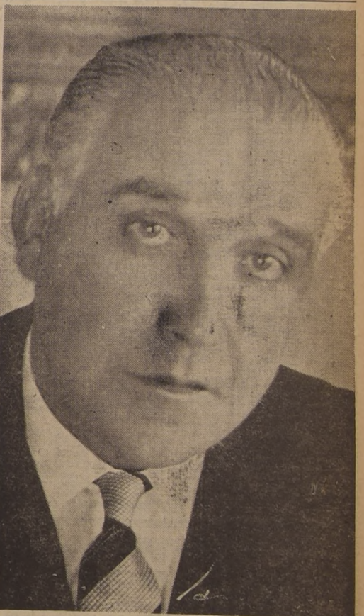
ALFREDO DUHALDE VASQUEZ. — Nació en Río Bueno en 1898. Estudió leyes en la Universidad de Chile y fue diputado radical por Llanquihue en 1924. Posteriormente, lo fue por Valdivia. En 1939 fue Embajador en Perú, y a fines del mismo año, Ministro de Defensa. Fue el primer Ministro de Defensa del Presidente Ríos. En 1945, fue Ministro del Interior y Vicepresidente de la República. Actualmente representa a la Novena Circunscripción, como senador del Partido Radical, en el cual ha militado desde muy joven.