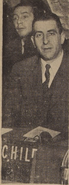
EDUARDO FREI MONTALVA. — Nació en Santiago el 16 de enero de 1911. Se tituló de abogado en la Universidad Católica en 1933. Fue profesor de Derecho del Trabajo en la misma Universidad, y "Elvira Matte de Cruchaga". Fue miembro de la Junta Ejecutiva del Partido Conservador, antes de la elección que dió como resultado la organización del Movimiento denominado Falange Nacional, del cual ha sido presidente. Es autor de varios libros. Fue Ministro de Obras Públicas y Vías de Comunicación. Actualmente es senador por Atacama y Coquimbo.