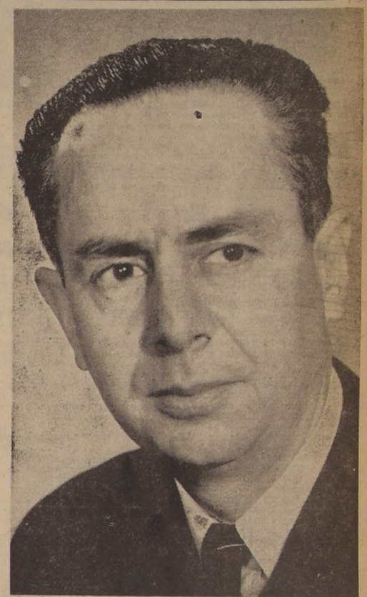
PEDRO ENRIQUE ALFONSO. — Nació en Ovalle el 25 de marzo de 1903. Se tituló de abogado en 1925. Fue Juez Letrado de Ovalle. Diputado en 1932 y miembro y dirigente del Partido Radical en Ovalle. Posteriormente, presidente del Partido Radical y del Frente Popular. Fue Ministro del Interior de la Administración Aguirre Cerda; Ministro de Hacienda y Ministro de Economía y Comercio. Representante de la Corporación de Salitre y Yodo, en Europa. Ha sido presidente de la LAN, Consejero del Banco Central y presidente del Consejo de LA NACION. Durante el viaje a Estados Unidos, del Presidente, señor Gabriel González Videla, sirvió el cargo de Vicepresidente de la República.

El Colegio "Louis Pasteur" donará ropa a la Sala Francia, del Hospital El Salvador, esta tarde a las 16 horas. Concurrirán los dirigentes del Centro de Padres y Apoderados mencionado plantel y un representante de la Embajada francesa. La ropa ha sido obtenida a base de obsequios y labores de las alumnas. Cada enfermo de la mencionada sala recibirá un paquete con regalos.