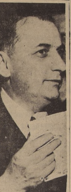
ÁNGEL FAIVOVICH. — Ha cabido al senador don Ángel Faivovich, presidente del Partido Radical, la grave responsabilidad de orientar las acciones políticas de su Partido frente a la Convención Presidencial que se inicia hoy, en la que deberá designarse al personero de la actual combinación de Gobierno, a la Primera Magistratura de la Nación. El senador Faivovich presidirá, por derecho propio, la Convención, que será dirigida en forma rotativa por los jefes de Partidos.

1.580 DELEGADOS DE SEIS PARTIDOS ELIGEN CANDIDATO Mañana inician las votaciones