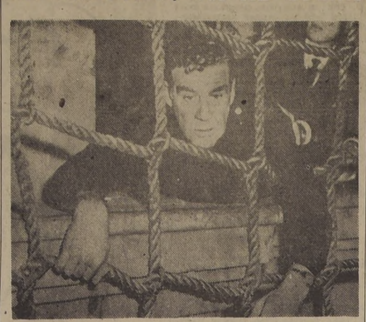
Paul Douglas en una dramática escena del film "Horas de espanto", que va al lunes en el Opera.

"Horas de espanto" es un relato bíblico con escenas de pasión y drama. Toda una ciudad aparece mantenida en suspenso por un suicidio. La cinta fue filmada en el famoso distrito de Wall Street, precisamente donde ocurrió el incidente en que se