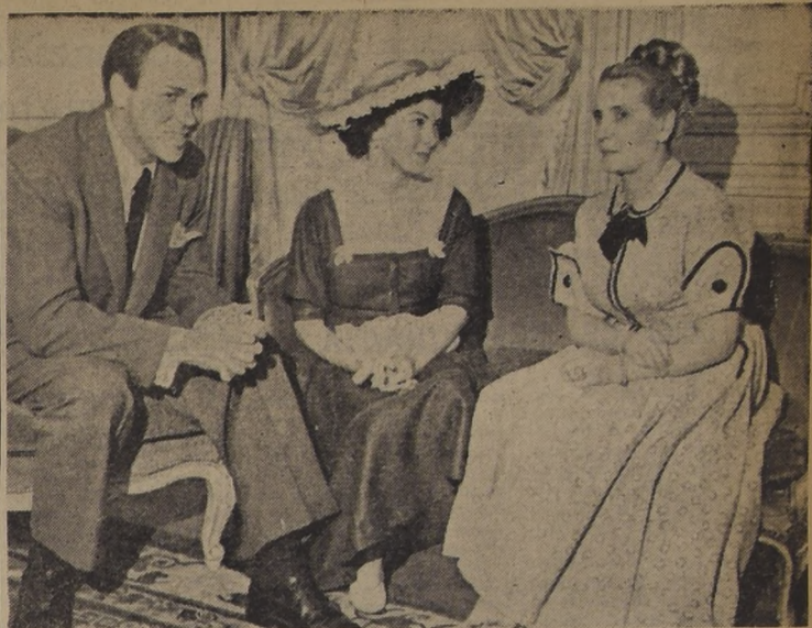
ACTORES DE CINE CON LA ESPOSA DE S. E.—Ayer a las 17.30 horas la esposa del Presidente de la República, señora Rosa Markmann de González, recibió a los actores norteamericanos Kathryn Grayson y Howard Keel. Departieron amigablemente por espacio de diez minutos, durante los cuales la Primera Dama hizo recuerdos de su viaje a Estados Unidos. Por su parte, los actores tuvieron frases de agradecimiento por los chilenos y de admiración de nuestro país