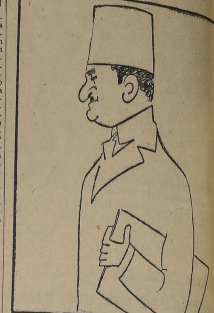
Alí Maher Pashá, nuevo "Premier" de Egipto, del que se supone que representa un criterio conciliatorio en la crisis anglo-egipcia.