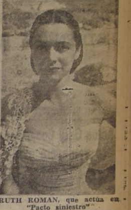
RUTH ROMAN, que actúa en "Pacto siniestro"

La figura de Roberto Montes, el joven galán del cine chileno, se destaca en el film "La Rosita del Cachapoal", última producción de nuestro cine, que será estrenada en fecha próxima.