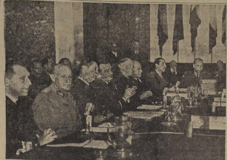
LOS CONSEJEROS MILITARES DE LA OTAN EN LISBOA. Delegaciones militares de Portugal, Gran Bretaña y Estados Unidos se reúnen por primera vez en Lisboa...