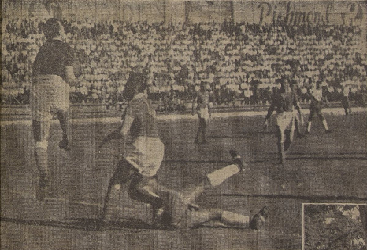
TRAPA LIVINGSTONE.— El centro delantero Mur ha rematado con violencia y Livingstone debe esforzarse por controlar en el suelo Negro para evitar que se produzca un gol. Más de 13 mil personas presenciaron en El Estadio Playa Ancha de Valparaíso el triunfo del Cali sobre la Selección Chilena, por 2 a 1.