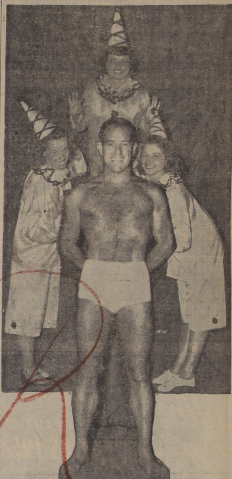
alcance de todos los días dos water shows en vermouth 6.20 y noche 9.40; el domingo 9, tres últimos water shows de clausura de la temporada santiaguina: en matinee a las 3 de la tarde, vermouth 6.20 y noche 9.40.

Al amanecer del lunes 10 próximo, la flota motorizada chilena "Cóndor" con sus 80 operarios, se desplazará a Valparaíso, llevándose completo todo el Water Show Carnival. Y en tiempo record de horas, como acostumbramos los chilenos cuando queremos ponerle el hombro, todo quedará listo a las 11 de la mañana para debutar a las 9.40 de la noche del lunes 10, cumplíndose con la seriedad y exactitud que la "Cónдор" acostumbra en sus anuncios.