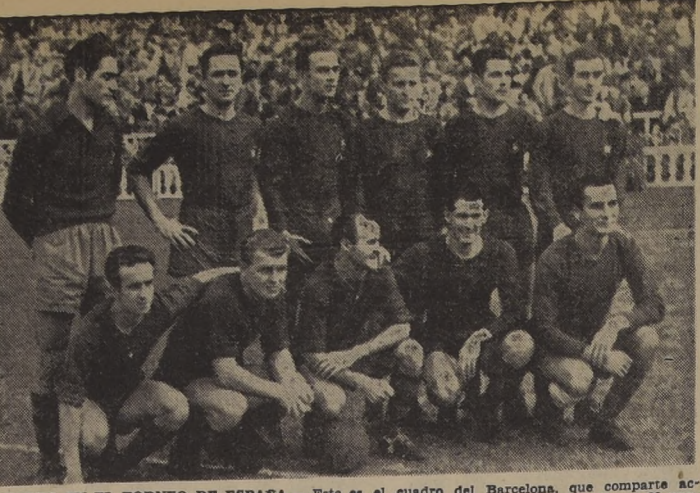
PUNTERO EN EL TORNEO DE ESPAÑA. - Este es el cuadro del Barcelona, que comparte actualmente el puesto de puntero del torneo español, con el Real de Madrid.

En esta oportunidad, cuando están muy cerca aun los resultados del campeonato nacional de Punta Arenas, me voy a referir a ellos.