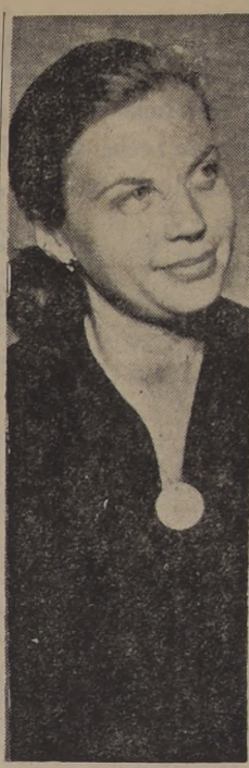
AGIL PERIODISTA DE EE. UU.

Trae además, esta edición, in- formaciones completas sobre las próximas temporadas de arte en Santiago y en el mundo, crítica literaria y artículos de mucho interés sobre teatro, artes plás- ticas, literatura y música. Con esta edición "Pro Arte" reanu- da su publicación semanal, in- terumpida por las vacaciones.