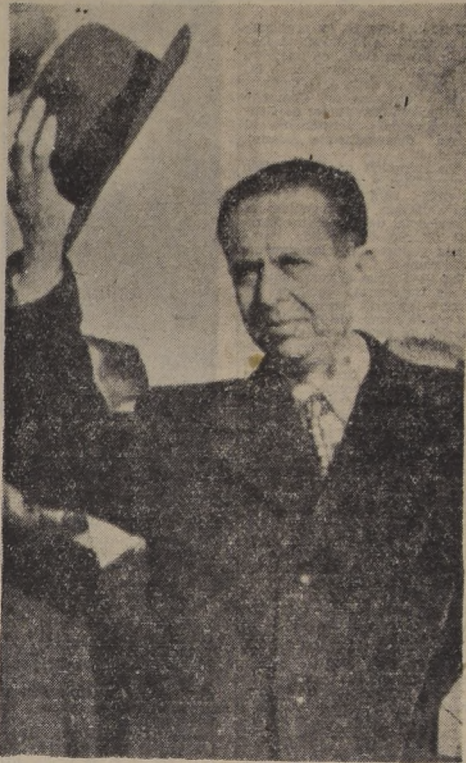
CHILE AUSTRAL CON ALFONSO.— Don Pedro Enrique Alfonso ha recibido durante su jira por Chiloé y Aysén la adhesión incondicional del pueblo que ve en él al continuador de la obra del recordado Presidente, don Pedro Aguirre Cerda, de quien fué uno de sus principales colaboradores, tanto como Ministro de Hacienda como del Interior.