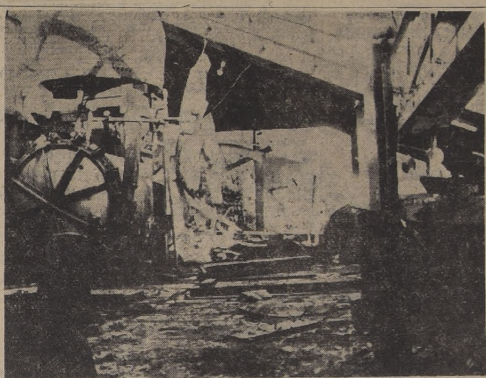
EXPLOSION EN FABRICA DE PRODUCTOS QUIMICOS.— En estado ruinoso quedó el taller de elaboración y de envase de la fábrica de Productos Químicos de la firma Teutcher después de hacer explosión el autoclave, causando la muerte de un obrero y lesiones graves en otros seis. Los daños fueron estimados en quinientos mil pesos.