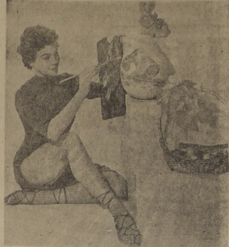
Leslie Caron también quiere demostrar sus aptitudes para la pintura en esta encantadora foto. La linda estrella francesa del ballet protagoniza junto a Gene Kelly la película, en technicolor, "Sinfonía de París".

En esta época, tanto la Embajada de Francia en nuestro país como la Cia. de Aviación Air France están estrechando los lazos que unen a artistas chilenos y franceses, en bien de las bellas artes.