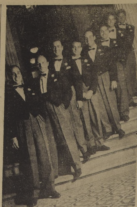
"LOS ESTUDIANTES" SE PRESENTARÁN EN EL HOTEL CARRERA ANTES DE VIAJAR A EUROPA. — En las postrimerías del presente mes debutarán en el Hotel Carrera "Los Estudiantes", quienes vienen retornando de una triunfal gira que los consagró como una orquesta espectáculo sin parangón en América Latina. Esta será su última presentación, antes de embarcarse a Europa, con destino a España, iniciando una extensa gira que culminará en Egipto.