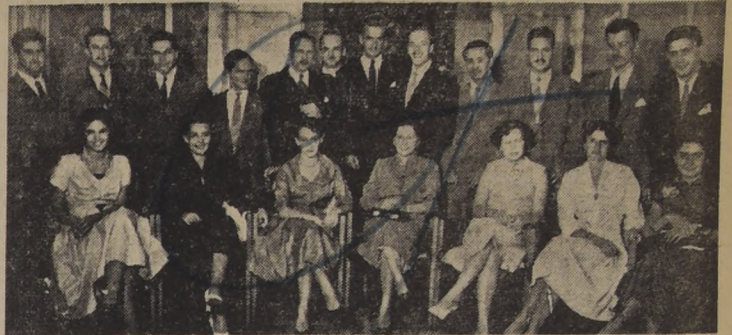
EN EL NURIA.—Asistentes a la comida en celebración del 5.º aniversario del Club "Tiburones"