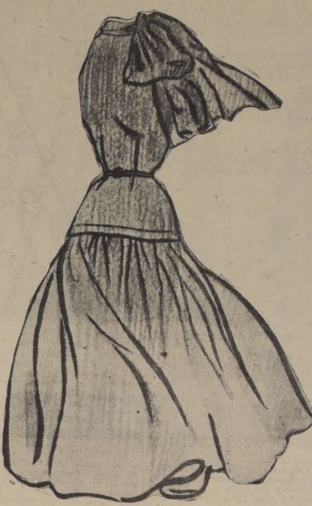
PARA LA SALIDA DEL TRABAJO. — Si después de la oficina se tiene un compromiso para un té, un traje de jersey será lo más apropiado. El modelo es un conjunto de casaca larga y falda recogida o tablada. El cuello se aviva con un echarpe de un color contrastante.

LA JOVENITA EN LA OFICINA. — La bata sin mangas y acompañada de un bolero, es un arreglo juvenil que puede ser adoptado por las oficinistas de pocos años. Se acompaña de un sweater o de una blusa de cuello subido y mangas largas.