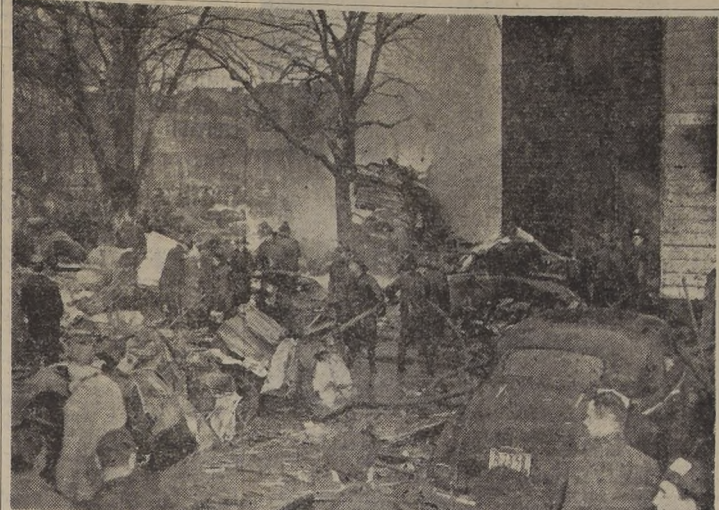
EL INFIERNO CAYO SOBRE EL BARRIO DE JAMAICA.— JAMAICA, Nueva York. — Auto destruido por todas partes y trozos de casas se ven en esta escena de verdadera pesadilla, después que un avión C-46 de carga, se incrustó en una casa de dos pisos, en el barrio de Jamaica, uno de los más densamente poblados de Nueva York, el 5 de abril. La casa de la derecha quedó totalmente destruida por el incendio, que se inició al quemarse el avión. Murieron cinco personas y 21 resultaron heridas en este nuevo desastre aéreo en plena población neoyorquina. A la izquierda de la casa se ve un auto destruido, que fue alcanzado por el avión al caer sobre la calle. Esta tragedia ocurrió a dos millas del aeropuerto internacional de Idlewild, en medio de un tiempo lluvioso y oscuro.