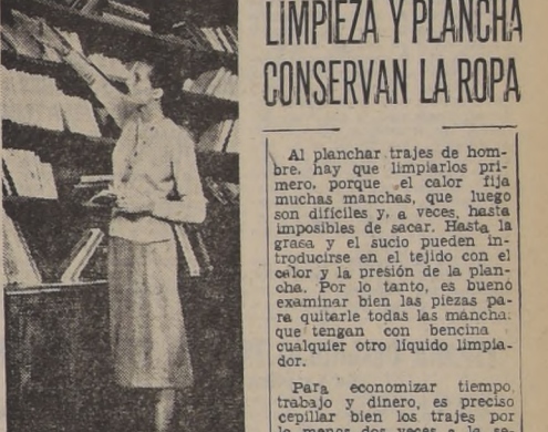
LIMPIEZA Y PLANCHA CONSERVAN LA ROPA Al planchar trajes de hombre hay que limpiarlos primero, porque el calor fija muchas manchas, que luego son difíciles y, a veces, hasta imposibles de sacar. Hasta la grasa y el sucio pueden introducirse en el tejido con el calor y la presión de la plancha. Por lo tanto, es bueno examinar bien las piezas para quitarle todas las manchas, que tengan con benzina cualquier otro líquido limpiador. Para economizar tiempo, trabajo y dinero, es preciso cepillar bien los trajes por lo menos dos veces a la semana, pasándoles la plancha perfectamente limpios. La única manera cuando están ropa bien cuidada dura mucho más tiempo y conserva su forma hasta que "se cae de vieja".

Si se necesita cortar el pan mientras está caliente, use un cuchillo caliente también. Cuando quiera ablandar mantequilla rápidamente, póngala en una taza debajo de una cacerola bien caliente, invertida. En unos momentos se podrá usar para esparcir sobre sandwiches, o para mezclar el bizcocho o galletitas. Espolvoree un poco de sal fina sobre la comida que se haya salido de la olla sobre la estufa o del molde en el horno, y evitará el humo en la cocina. Si se le agrega una rebanada de pan a la col mientras se cocina, se eliminará mucho del olor desagradable que deja en la casa. Si una receta dice "una taza de mantequilla derretida", ésta deberá derretirse antes de medirla, si dice "derribe una taza de mantequilla", se derribe después de medida. Si sólo se necesita media taza de mantequilla, se llena la taza hasta la mitad con agua fría, y se le añaden cucharadas de mantequilla, hasta que el agua llegue al borde de la taza. Luego se tira el agua y quedará la mantequilla medida exactamente.