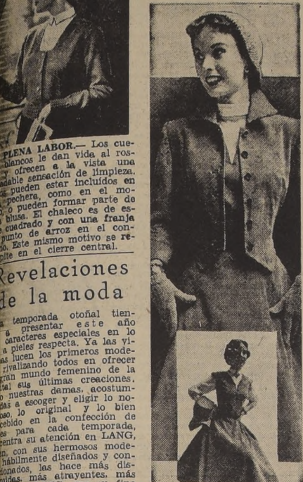
Revelaciones de la moda

La temporada otoñal tiene caracteres especiales en lo que a pieles respecta. Ya las yemas lucen los primeros modelos rivalizando todos en ofrecer al gran mundo creaciones, algunas de ellas últimas creaciones, que nuestras damas, acostumbradas a escoger y elegir lo novedoso, lo original y lo bien confeccionado en la confección de pieles para cada temporada, concentran su atención en LANG, con sus hermosos modelos, habilmente diseñados y confeccionados, las hace más distinguidas, más atractivas, más admiradas. LANG, con su fino gusto para ofrecer siempre lo mejor, presenta diariamente en su elegante salón de exhibición, de Merced 297, tercer piso, las últimas creaciones de la temporada, inspiradas en los últimos éxitos de París, en su pasada temporada invernal.