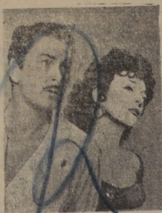
Errol Flynn y Archelina Freyre en "La taberna maldita" estreno extraordinario del gran Cine Plaza.