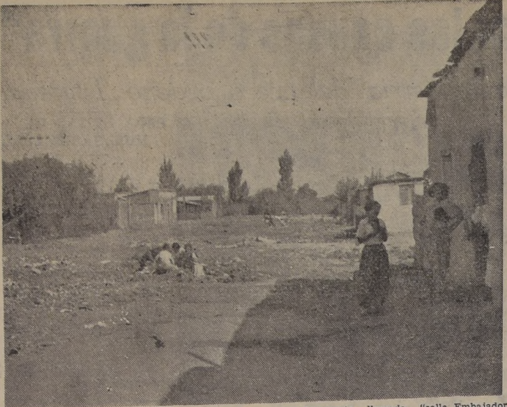
ASI Y TODO, LA LLAMAN CALLE. Esta es la ampolosamente llamada "calle Embajador Quintana"...

VALPARAISO: SANTIAGO: Av. Errázuriz 401 Huérfanos 1247