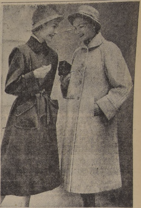
ABRIGOS CLASICOS. — Los abrigos de sport, prácticos y elegantes, es el tipo clásico que debe adoptar la mujer que va a la oficina. Si la silueta es fina, se puede elegir uno con cinturón, como el de la izquierda. Cualquiera de los dos modelos sirven maravillosamente para usarlos en los días del invierno que se avecina.

LOS PERFUMES ESTE ES UN PUNTO QUE NO SE DEBE DEJAR PASAR. Hay perfumes que ponen los nervios de punta en tal forma que al sentirlos no se puede ni siquiera trabajar. Ciertos perfumes, al igual que los gritos, son estridentes y a veces hasta mareadores, y las personas que los usan se hacen temibles al pasar al lado de alguien. Una tenue fragancia, fresca y sutil, es la apropiada para el trabajo, si es que gusta de los perfumes.