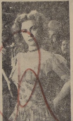
María Antonieta Pons en "Piña Madura", que va el martes en el Santiago

María Antonieta Pons, estrella de la cinematografía mexicana, aparecerá en una nueva producción filmica. Es en "Piña Madura", en la que María Antonieta Pons, junto al galán Armando Calvo, baila nuevas danzas tropicales. Su estreno se anuncia para el martes en el Santiago.