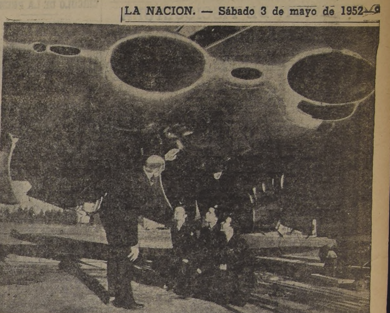
PRIMER AVION A CHORRO, PARA PASAJEROS. — La British Overseas Airways Corporation, ha anunciado que el primer servicio del mundo con aviones a chorro para pasajeros se inauguró ayer, cuya máquina aparece en el grabado. El "Comet" De Havilland que surca los espacios a una velocidad de 800 kilómetros por hora y a una altura de 35 mil a 40 mil pies, debe despegarse del aeropuerto de Londres, en su vuelo inaugural de 6.724 millas llevando pasajeros hasta Johannesburgo. El primer servicio de pasajeros con aviones a chorro entre África del Sur y Gran Bretaña quedará inaugurado el lunes 5 de mayo. El tiempo efectivo de vuelo del Comet entre el aeropuerto de Londres y Johannesburgo será de 18 horas 40 minutos y entre Johannesburgo y Londres y Johannesburgo —con escalas en Roma, Beirut, Kartoum, Estebé (Uganda) y Livingstone— será de 23 horas 40 minutos. El vuelo de regreso a Londres, con las mismas escalas, será de 23 hrs. 55 min.

SEUL, Corea, 2 (UP). — Los aviones de guerra de las Naciones Unidas lanzaron ayer su más grande golpe de la guerra contra los comunistas, efectuando 1.283 salidas hacia Corea del Norte, para atacar las posiciones rojas, los camiones, líneas ferroviarias y medios de transporte.