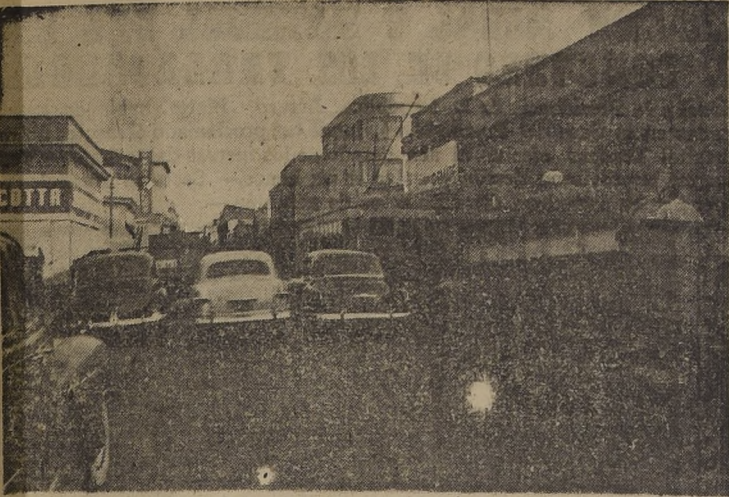
ABREN LAS PUERTAS DE SANTIAGO, POR EL SUR.— San Diego, puerta de salida de Santiago hacia el sur, continúa estrechándose cada día más por el intenso tránsito y sus absurdos embotellamientos. Camiones que desahogan o caigan a toda hora, y coches cuyos dueños utilizan calle como boxe, para no pagar en un garage. El atasco es una muestra elocuente de lo que acaecerá.

Compuestas de 1 baño revestido 5 1/2 pies, con su combinación automática tipo "Crown"; 1 silencioso, tipo "Tocopa", Caupulicán o Talca; 1 lavatorio de pedestal tipo Pisagua o Siga; 1 bidet modelo Fanalza, todo con sus fittings cromados completos. Gran cantidad de artefactos sueltos, cocinas, lavaplatos, califones, termos eléctricos etc. Tramitaciones por Caja. FACILIDADES SAN DIEGO 2385 FONO 51318 Se atiende hasta las 20.30 horas. También sábados.