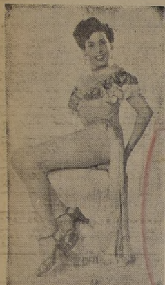
Raquel Mata, intérprete de bailes tropicales