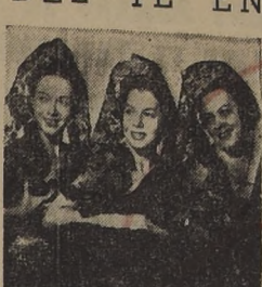
EL TRIO MORENO, intérprete de las canciones españolas, gusta en sus actuaciones de la hora del té y en las reuniones nocturnas del "Violin Gitano".