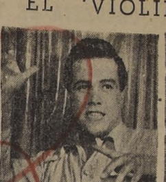
REGULO RAMIREZ, es el astro colombiano de la canción continental que recibe, en sus actuaciones, calurosas felicitaciones por su acertado repertorio de canciones de todos los gustos.