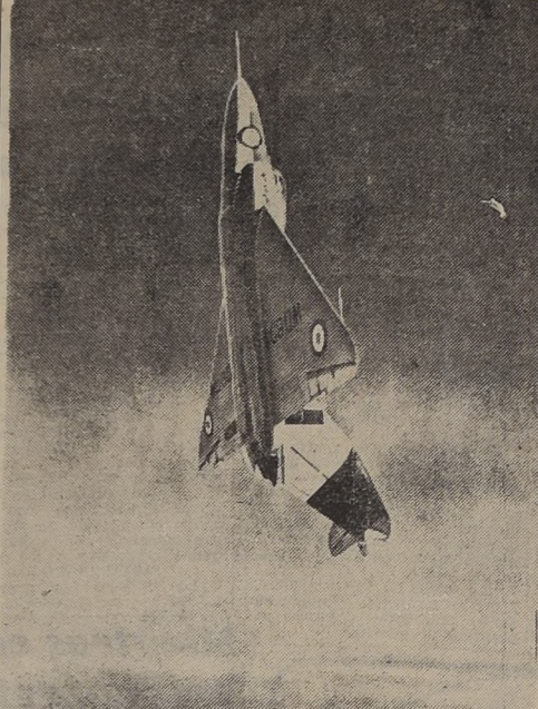
NUEVO CAZA DE PROPULSION A COHETE. — LONDRES. — El Ministerio británico del Aire hizo un sorprendente anuncio el 7 de junio, cuando hizo saber que su avión de caza de propulsión a cohete, GA-5, la primera máquina Delta de operaciones en el mundo, había sido elegido como el arma defensiva atómica de super-prioridad. Este caza está destinado a destruir bombarderos atómicos a enormes alturas. El caza está equipado con dos motores Sapphire y de una nueva ala revolucionaria de forma triangular. — (FOFO UNITED PRESS).

Declaraciones similares precedieron al cierre de la frontera entre Alemania Oriental y Alemania Occidental y al establecimiento de una "zona prohibida", de la cual han sido evacuadas todas las personas con excepción de los comunistas de toda confianza.