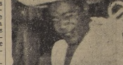
NELSON FERRAZ, baritono del Folkloro brasileño.