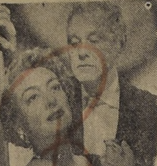
JOAN CRAWFORD y DAVID BRIAN, en "La Intrigante".

Pasiones de fuego, intrigas y un tenso final hay en el drama de la Warner Bros, titulado "La Intrigante", en que Joan Crawford tiene el papel principal, porque es el centro de las intrigas de algunos pandilleros millonarios.