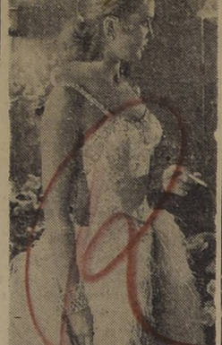
DORIS DAY, la intérprete de "Te veré en mis sueños", que estrenará el martes el Teatro Central