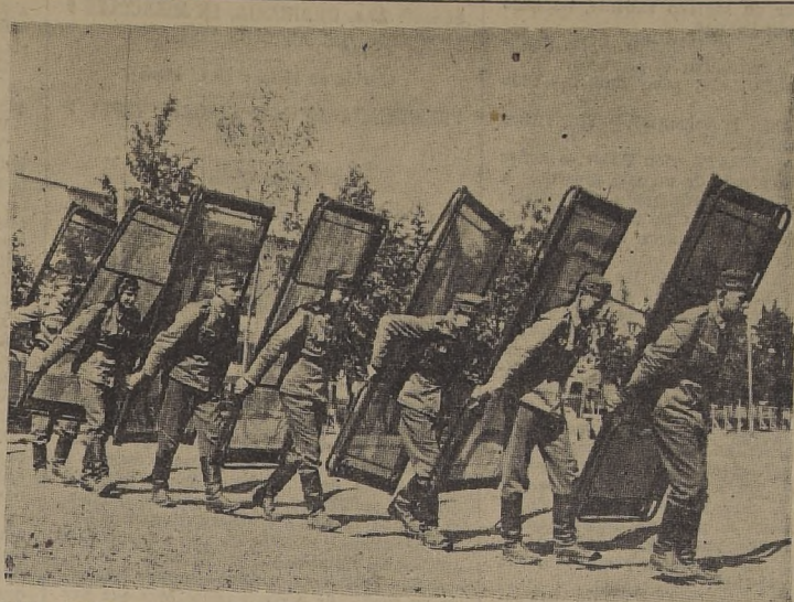
ALISTANDO LA VILLA. — Jóvenes soldados finlandeses hacen el traslado de camas a las diferentes residencias de la Villa Olímpica, que albergará a 5.000 deportistas de todo el mundo, que intervendrán en los XV Juegos Olímpicos de Helsinki.

HELSINKI, 11. (UP). — El presidente del Comité Olímpico de Chile, señor Alejandro Rivera, llegó ayer a esta capital después de un viaje de 48 horas en avión desde Santiago, y dijo que su país cifraba sus esperanzas en los juegos olímpicos de 1952, en los equipos ecuestre y de básquetbol. Expresó: "Por supuesto que nos agrada ganar algunas competencias, pero el conjunto chileno viene a Helsinki fundamentalmente, para competir y mejorar las relaciones amistosas con otras naciones".