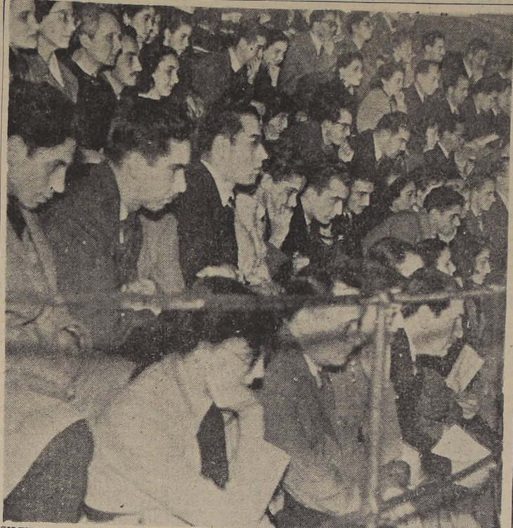
SILENCIO Y RECOGIMIENTO. — Con la misma actitud con que se entra a un templo, el público escucha a la Orquesta Sinfónica de Chile, dirigida por el gran maestro Sir Malcolm Sargent. Los rostros están graves, abstraídos, reconcentrados las mentes en el yo interior. Nada de balcón, suben, escalonándose, hasta el anfiteatro y la galería. El lente de LA NACION captó esta foto en el anfiteatro en los instantes en que Sir Malcolm Sargent estrenaba para el público santiaguino la obra de Walton, "Obertura Scapino".

Mil cuatrocientas personas que llenaron totalmente las apositaduras del Teatro Municipal, pagaron anoche el tributo de su silencio recogido escuchando la Orquesta Sinfónica de Chile, dirigida por última vez por Sir Malcolm Sargent. El gran director inglés se despidió del público santiaguino, estrenando dos obras modernas. Obertura Scapino, de William Walton, y Sinfonía No. 4 en Sol Mayor, de Anton Dvorak. Fue el concierto de despedida. Sargent parte hoy a Lima, a cumplir compromisos. Al mandato de su batuta y de su imperiosa mano izquierda, famosa ya en el mundo, el director inglés dirigió la Orquesta Sinfónica de Chile, que en 1951, le llaman los fanáticos, como quisiera a los asistentes, los ochenta y cinco integrantes de la orquesta, vestidos de rigor escénico. —Tras los varones, que fueron aplaudidos entusiastamente en este décimo concierto, y, sin embargo, el público no respaldó al Coliseo como sucedió cuando Celibidache dirigió la Séptima Sinfonía de Beethoven en 1951. "La gente va a escuchar lo que le gusta y lo que ya conoce", que es el lema de Sargent, más que ganar, le interesa dar a conocer a los compositores de la nueva generación. Mil dólares le pagó el Instituto de Extensión Musical por cada concierto. Sargent dirigió cuatro de ellos, uno matinal y dos en la noche. Es la segunda vez que visita nuestro país y se ha mostrado encantado. En su reciente visita a nuestro país.