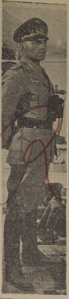
JAMES MASON en el papel de Mariscal Rommel