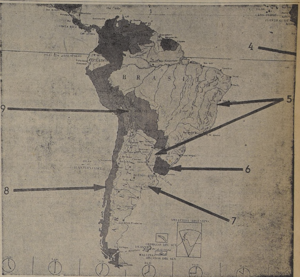
Facsimil del mapa de propaganda antichilena destinado al Cónsul argentino en Los Andes, haciendo planteamientos políticos de orden interno en los países sudamericanos.