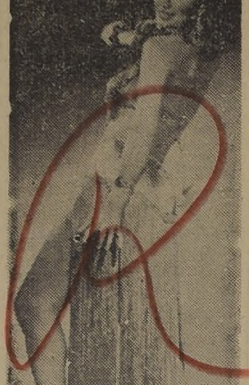
YVONNE LAMARR DEBUTA HOY EN EL TAP ROOM