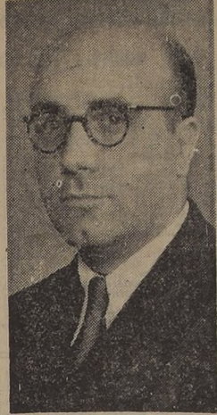
DON FERNANDO DE ARAGON es interpretado en "Fuenteovejuna"

HOY se estrenará "Bruma de sangre", en el cine Roxy