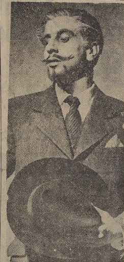
ENRIQUE IV es la obra que está preparando el Teatro de Ensayo

Siempre ha sido un misterio para el público la vida privada de los luchadores del popular deporte del "catch as catch can"