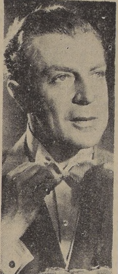
Victor de Kowa, famoso artista alemán, que está en Santiago.