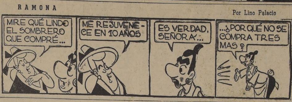
Por Lino Palacio