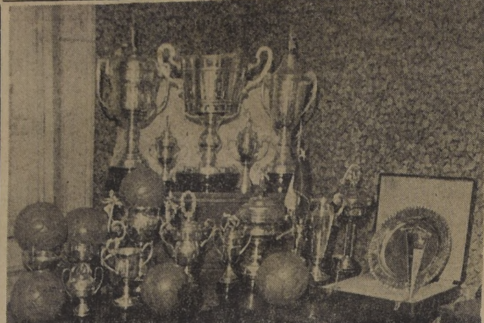
PREMIOS PARA EL FUTBOL IQUIQUEÑO. — Con motivo de iniciarse la competencia oficial de fútbol en Iquique los deportistas residentes en Santiago observaron numerosos premios a los dirigentes que vinieron a solicitar el concurso de un equipo sueno, para que actúen en esa ciudad próximamente. El grabado muestra los valiosos trofeos donados por los iquiqueños que residen en esta capital.