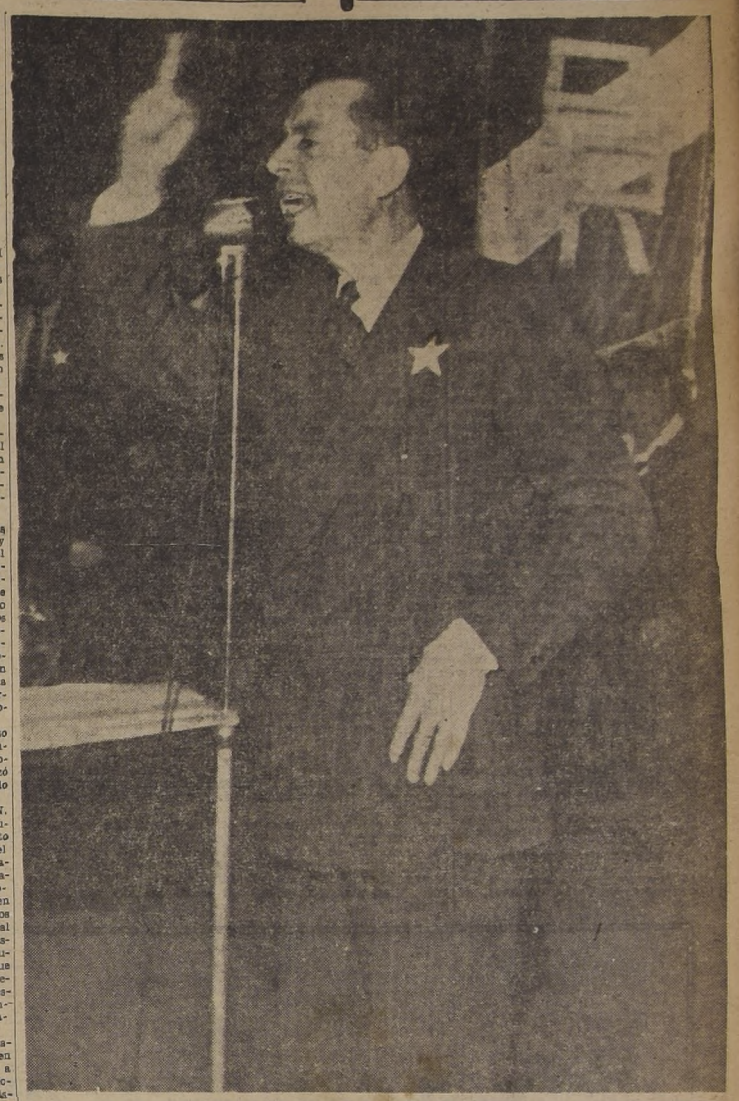
SÍMBOLO DE LA VICTORIA. — Ostentando la estrella de nuestro Pabellón Nacional, el abanderado de la combinación de centro-izquierda, don Pedro Enrique Alfonso, dirige la palabra a la ciudadanía de Arica, en la memorable oportunidad en que, como nunca se observó en ese puerto, se proclamaba su nombre como abanderado de la democracia para la lucha presidencial. Fué en esta oportunidad en que, como símbolo de victoria, el señor Pedro Enrique Alfonso, los miembros de su comitiva y todos los asistentes a su proclamación, acordaron llevar en su solapa una estrella, la misma que Chile ha llevado en su Pabellón Nacional, victoriosamente, a través de toda su historia. A raíz de esta plausible iniciativa, el Comando Nacional ordenó ayer confeccionar un millón de estrellas, que en adelante, y durante toda la campaña y hasta el 4 de septiembre, ostentarán los elementos democráticos de Chile, como símbolo de libertad y justicia social.