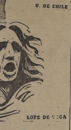
LOPE DE VEGA