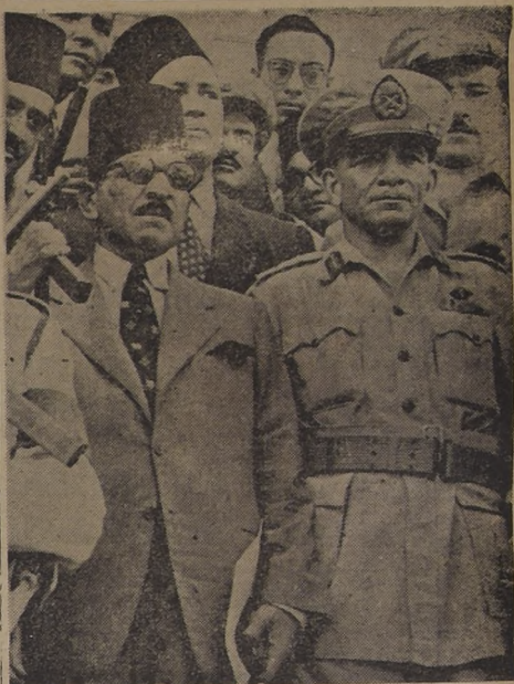
MOJENTOS DE TENSION VIVE EGIPTO.— EL CAIRO.— El teniente general Mohamed Naguib Bey (derecha), comandante en jefe de las fuerzas armadas, el "hombre fuerte" de Egipto, cuyo golpe militar de estado derrocó al rey Farouk, quien, después de abdicar a favor de su hijo de siete meses de edad, Ahmed Fuaed II, huyó a la Isla de Capri. A la izquierda está el nuevo Primer Ministro egipcio, Aly Maher Bajá, con quien discute ahora el futuro de Egipto.

EL CAIRO, 7.— (U.P.).— (Por Walter Collins).— El general Mohamed Naguib, invitó a Estados Unidos y a otros países occidentales, a que presten ayuda militar a Egipto e insistió que si no la obtiene el oeste, puede verse obligado a buscarla en el Este.