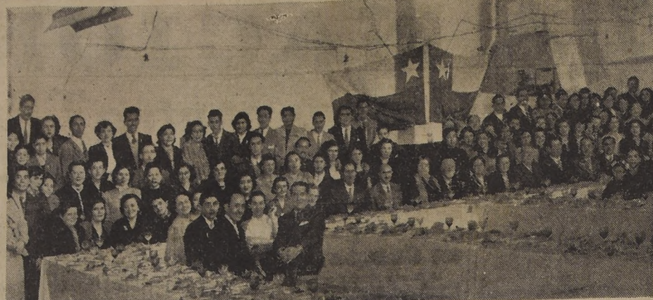
ALMUERZO DEL PERSONAL DE "TEJIDOS CAFFARENA". —Ayer se efectuó el almuerzo que anualmente ofrece la firma Tejidos Caffarena S. A., a su personal. En esta ocasión se hizo entrega de una insignia de oro a cuatro obreros que cumplieron 20 años de servicio en la firma, anunciándose también un aumento de salarios. En el grabado, parte de la concurrencia a esta cordial manifestación.