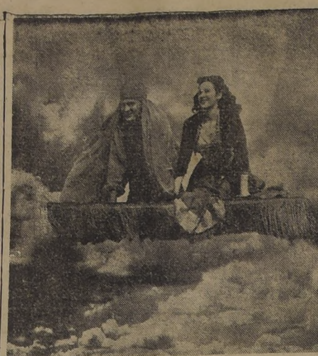
"LA ALFOMBRA MAGICA", de Columbia Pictures, que aterrizará en los cines Santa Lucia y Continental