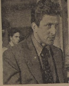
KIRK DOUGLAS, estrella de "Antesala del infierno"