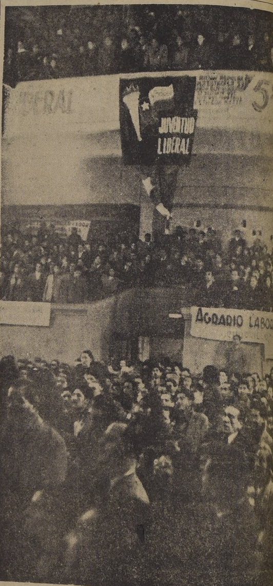
Vista parcial de la concurrencia al imponente acto público con que fue recibido el señor Matte, por el barrio Independencia, en el Teatro Valencia de la capital.

Por otra parte, la acusación de esta mal planteada, ya que la Constitución establece la responsabilidad solidaria de todos los Ministros y no puede en consecuencia ser dividida.