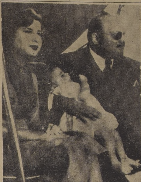
LA FAMILIA REAL EGIPCIA EN EL DESTIERRO.— CAPRI (Italia).— La ex reina Nariman, el nuevo rey Ahmed Fuaed II, de siete meses de edad, y el ex soberano Farouk de Egipto, fotografiados en uno de los jardines del hotel de la Isla de Capri, en el que se encuentran hospedados, después de haber sido destituido el rey Farouk por un golpe militar de estado.

HONOLULU, 7. (U.P.).— Los principales diplomáticos de Estados Unidos, Australia y Nueva Zelanda, pusieron fin a la medianoche, a su histórica conferencia de tres días, después de dejar establecido un organismo permanente militar, para que trace los planes de defensa.