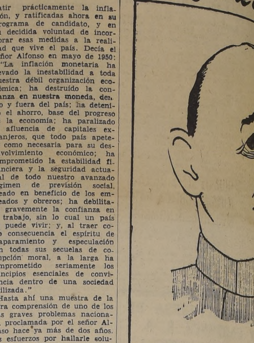
Laurenti P. Beria, el jefe de la tenebrosa policía Soviética, que participa en una reunión en Bogotá los servicios policiales de las democracias