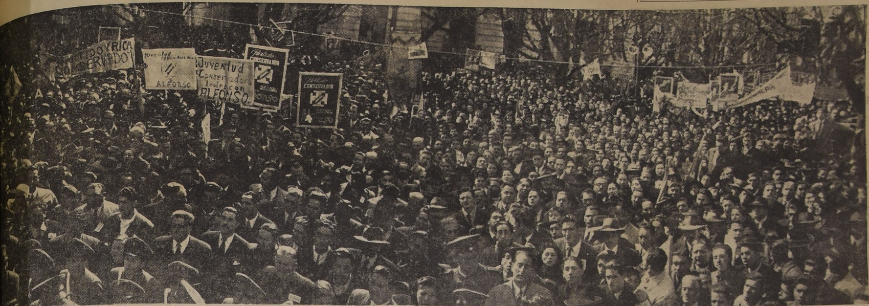
La imponente marcha de la victoria con que Alfonso se presentó en la cruzada nacional que representa el mantenimiento del régimen de libertad y de justicia social. Cuando se inició