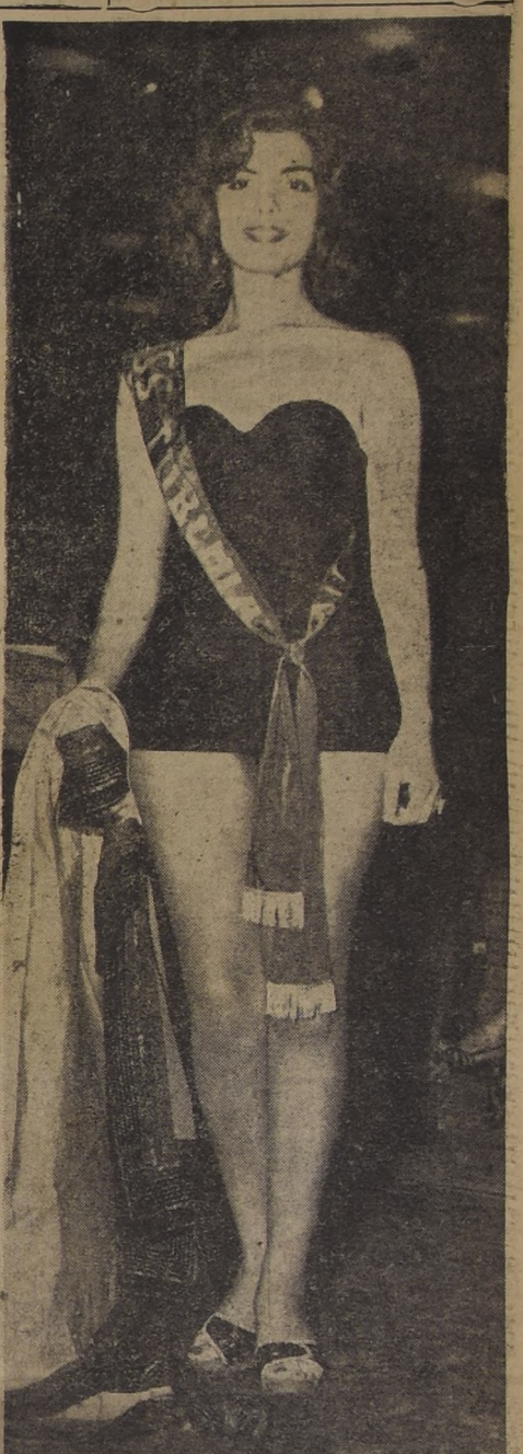
LA DISCUTIDA "MISS EUROPA, 1952" — NAPOLES — La hermosa belleza italiana Gisella Busar, "Miss Turquia", fue elegida entre 20 bellezas europeas como "Miss Europa, 1952". Su designación atrajo las protestas de "Miss France", Nicole Drouin, y más tarde, las de Miss Italia y Miss Alemania. La belleza turca tiene 21 años de edad; es de Estambul.

... El protocolo adicional al Tratado de Comercio es singularmente importante, porque comprende el intercambio de salitre y cobre principalmente, por algodón, café, cacao, caucho, yerba mate y otros productos brasileños. Como lo anunciamos en su oportunidad Chile se compromete a proporcionar a Brasil todo el salitre que necesite para su consumo interno, y éste a su vez a no instalar plantas para producir salitre sintético.