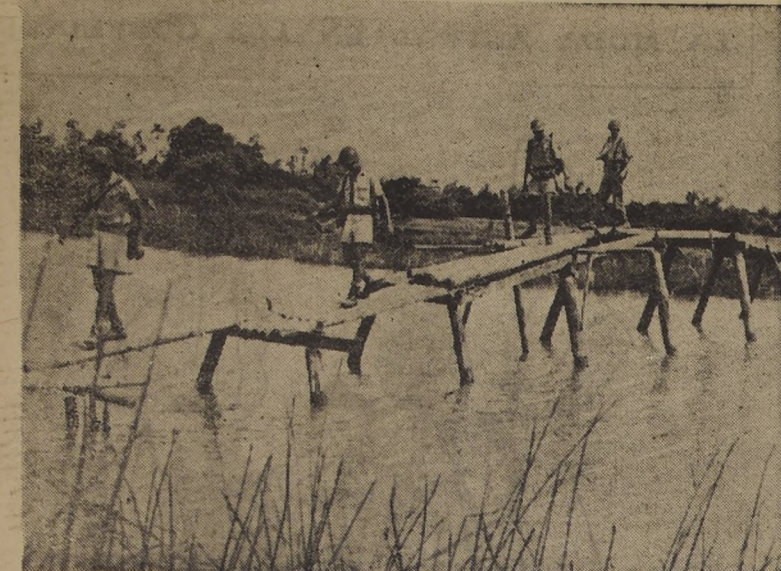
LA GUERRA EN INDOCHINA.—INDOCHINA FRANCESA.— Tropas francesas regresan de una operación en la Indochina y cruzan un precario puente sobre un río, que parece haber sido construido apresuradamente. Este grupo fué enviado a reforzar puestos de avanzada.— (Foto U. P.).