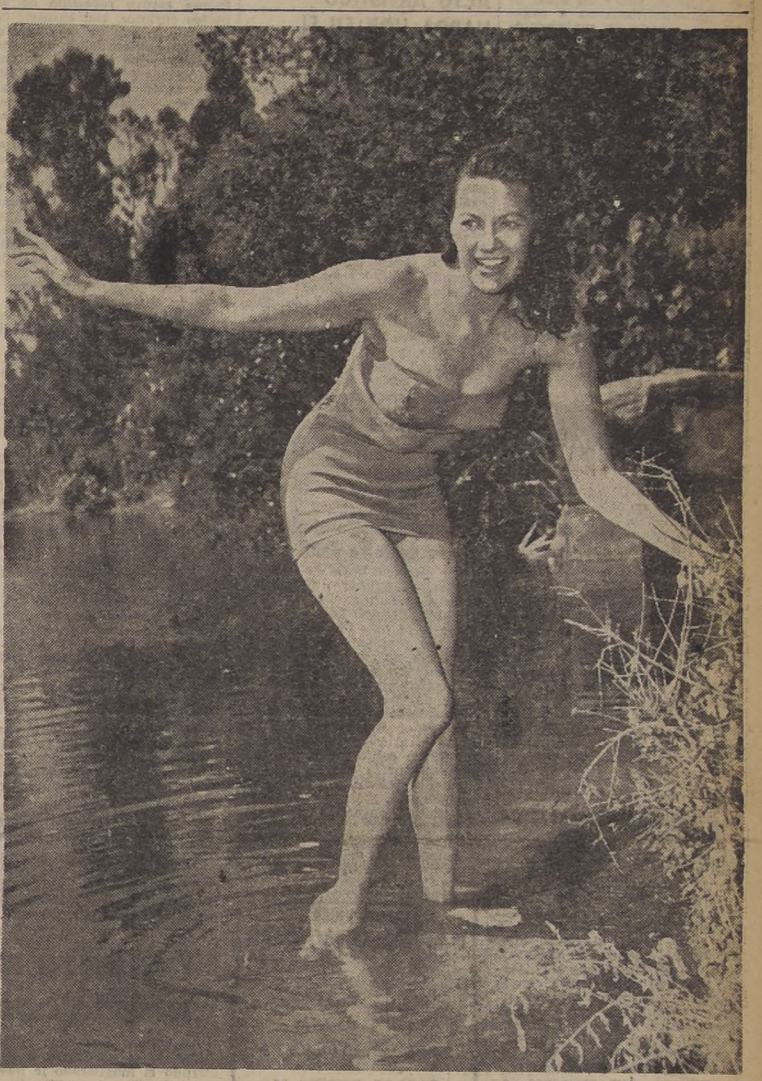
YVONNE DE CARLO EN MEXICO. — MEXICO.— La actriz de cine Yvonne De Carlo, en una a un arroyo en un lugar pintoresco cercano a la frontera de México con Estados Unidos. Anduvo por estos parajes buscando escenarios para la película "Sombrero", que se está filmando en México.— (Foto UNITED PRESS).—