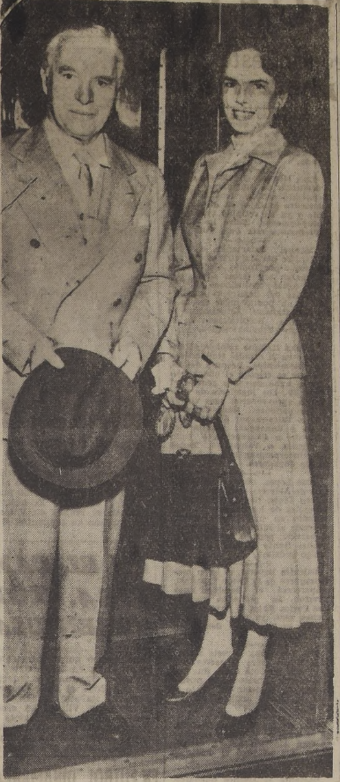
CHARLES CHAPLIN Y SU ESPOSA PARTEN PARA EUROPA. PODRAN REGRESAR? El genial actor cómico y mímico británico Charles Spencer Chaplin, y su esposa, Oona O'Neill, hija del aplaudido dramaturgo Eugene O'Neill, llegan a Nueva York procedentes de Hollywood, para embarcarse en viaje de placer a Inglaterra, el 18 de septiembre. Durante la travesía marítima, el Procurador General de la República, James McGranery, ordenó a los servicios de inmigración que Chaplin fuera detenido a su regreso a Estados Unidos para que asistiera a una investigación en relación a sus pretendidas simpatías en favor del izquierdismo. Chaplin es ciudadano británico, y ha vivido muchos años en Estados Unidos sin documentos de naturalización. Viaja también en compañía de sus hijos, e Inglaterra le hará ahora una recepción triunfal.—(FOTO UNITED PRESS).

LONDRES, 22.—(U.P.).—El Primer Ministro Winston Churchill se dispone a presentar a los aliados occidentales un nuevo plan de defensa que hace más hincapié en los aviones de más alcance y en el uso de bombas y misiles y en el uso de los aviones de combate. Los informes de París dicen que Churchill encargó el plan al Estado Mayor Imperial y se cree que ya ha sido sometido al Estado Mayor Central Mixto de Washington para lo común. Según las noticias de París el Primer Ministro Churchill se basa en la opinión de que no habrá agresión rusa en dos años y que para entonces el occidente, gracias a la superioridad técnica, tendrá una ventaja clara sobre Rusia.