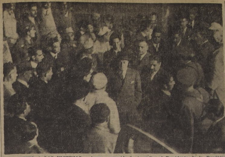
S. E. JUNTO A LAS VICTIMAS.—Apenas ocurrida la tragedia, el Presidente de la República concurrió al edificio en construcción. Posteriormente ordenó el envío de un proyecto de ley, mediante el cual, el Gobierno irá en socorro de las víctimas y de sus familiares.

PARTIDO AGRARIO-LABORISTA. —El Congreso Sindical y Gremial Nacional acordó asociarse al pueblo que aflige a la clase trabajadora por el trágico suceso; solicitar la designación de un Ministro en Visita que investigue los hechos; hacerse representar en los funerales y solicitar del Gobierno el envío de un mensaje en carácter de urgente al Congreso Nacional, con el fin de indemnizar a la familia de los muertos y heridos.