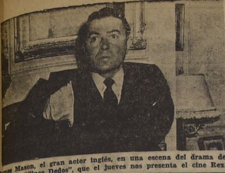
James Mason, el gran actor inglés, en una escena del drama de espionaje "Cinco Dedos", que el jueves nos presenta el cine Rex.