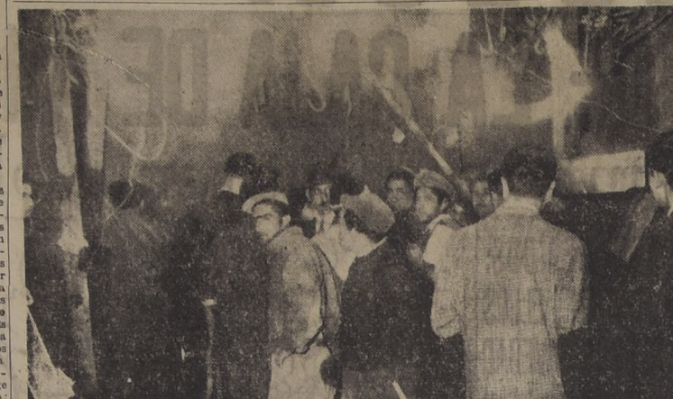
HACIA EL PUNTO DE LA TRAGEDIA.— Un grupo de obreros de la construcción se dirige por los subterráneos del edificio de Alameda con Morandé, hacia el punto del accidente. Los rostros reflejan la profunda tragedia; la emoción embargaba en aquellos momentos todos los espíritus.