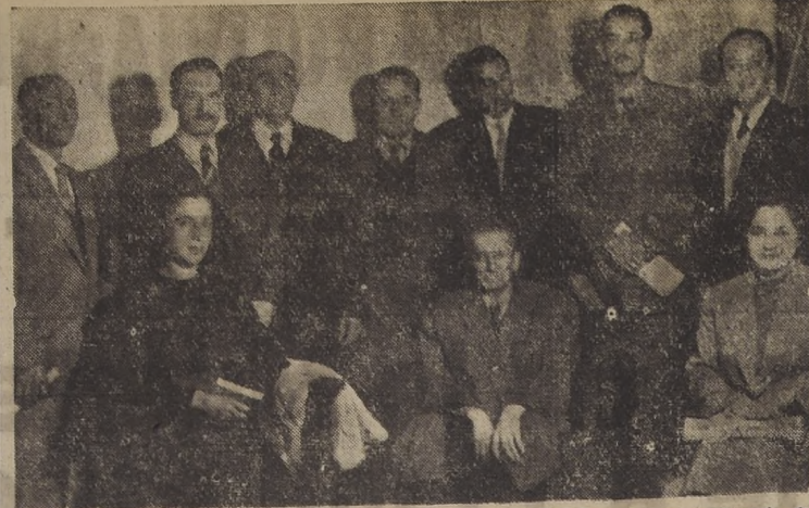
INAUGURAN ASAMBLEA NACIONAL DE LA PEQUEÑA MINERIA...