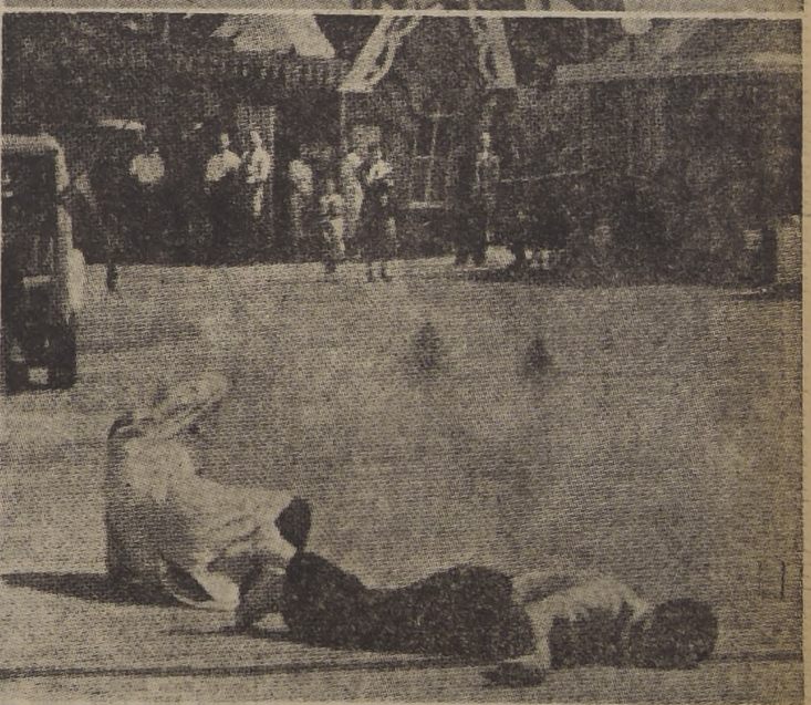
EL ALAMBRE TAMBIEN TRAICIONA A LOS ACROBATAS. — Acaba de ocurrir en Battersea, Inglaterra, donde el mundialmente famoso ciclista aéreo español Miguel Esterlich, después de haber recorrido medio mundo cosechando gloria y fortuna, estuvo a un paso de la muerte. En medio de la expectación de la enorme concurrencia cayó desde veinte metros de altura. Estos asientos gráficos sobre los dos momentos culminantes del accidente. Arriba, vuela la endeble bicicleta que corría sobre el cable. Abajo, Esterlich cae al suelo, como besando la tierra que lo iba a recibir en mortal abrazo, que le sirve de dura pista de aterrizaje en este sorprendente desenlace de su número acrobático, en que cayó sobre un espectador. Herido gravemente en la espalda, con doble fractura en la columna vertebral, lucha hoy entre la vida y la muerte. Mientras tanto, en Santiago, a 40 metros de altura, cuatro juveniles acróbatas alemanes, en asombrosas pruebas, desafían la muerte.