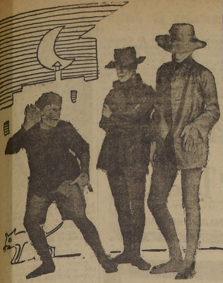
LOS COGOTEROS Y EL "LORO", escena de "El frac", pantomima que será estrenada el jueves 23 en el Petit Rex, en funciones de vernouth y noche, por la Compañía Mímica de Alejandro Jorowsky. En este mimodrama aparecen diversas escenas y personajes típicos de nuestra capital, como ser, un cogotero, el Parimiro, la calle Ahumada, etc. Esta compañía actuará solamente los jueves

Mañana se presentará en el T. Municipal a las 19 horas, se llevará a efecto el segundo concierto de Walter Giesecking. El programa es el siguiente: Beethoven, Op. 31 N.º 2. Brahms, Op. 3 Intermedios, La mayor, op. 118 N.º 2; Mi bemol menor, op. 118 N.º 6; Fa mayor, op. 118 N.º 5 (Romanza). Debussy.— Siete Preudios (del primer cuaderno): Danseuse de Delphes, Volées des collines d'Anacapriés pas sur la neige —Ce qua vu le vent d'Ouest— La fille aux cheveux de lin, La Cathédrale engloutie. Liszt.— Benediction de Dieu dans la solitude; Allegro-Moderato; Andante, Tempo primo.