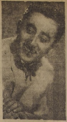
CELEBRADO HUMORISTA — Chito Morales, el celebrado humorista chileno que tantos aplausos cosechó con su creación "Florido", partirá próximamente al norte del país, acompañado del dúo folclórico Bascuñán-Del Campo.

Mañana se presentará en el T. Municipal a las 19 horas, se llevará a efecto el segundo concierto de Walter Giesecking. El programa es el siguiente: Beethoven, Op. 31 N.º 2. Brahms, Op. 3 Intermedios, La mayor, op. 118 N.º 2; Mi bemol menor, op. 118 N.º 6; Fa mayor, op. 118 N.º 5 (Romanza). Debussy.— Siete Preudios (del primer cuaderno): Danseuse de Delphes, Volées des collines d'Anacapriés pas sur la neige —Ce qua vu le vent d'Ouest— La fille aux cheveux de lin, La Cathédrale engloutie. Liszt.— Benediction de Dieu dans la solitude; Allegro-Moderato; Andante, Tempo primo.