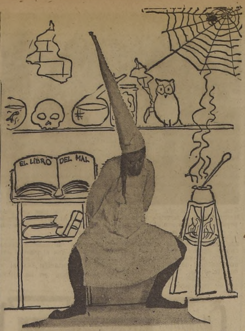
"EL DIABLO, DISFRAZADO DE NIGROMANTE", personaje de "Pierrot y su sombra", pantomima clásica al estilo de la "Comedia del arte", que será estrenada por la Cia. de Alejandro Jodorowsky el jueves 23 en el Petit Rex, en vermouth y noche