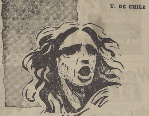
Lope de Vega