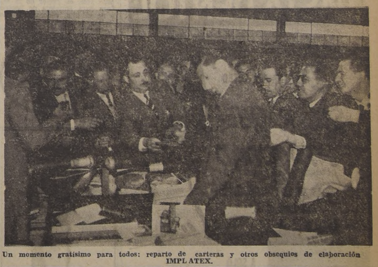
Un momento gratísimo para todos: reparto de carteras y otros obsequios de elaboración IMPLATEX.