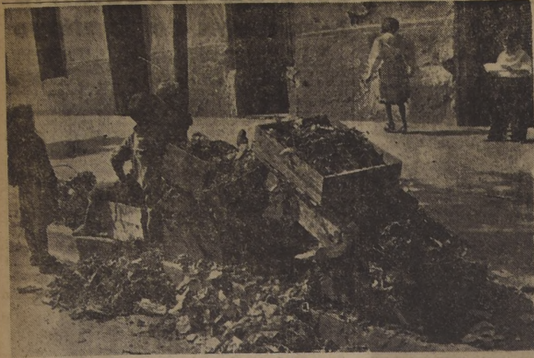
BASURA Y ABANDONO, SIN HUELGA DE BARRENDOS. — No hubo ayer ninguna huelga de obreros municipales, lo que ya puede estimarse un hecho extraordinario. Pero es el caso de que la basura no fue retirada del frente de los domicilios sino hasta después de las 11 horas, y en diversos barrios en la tarde. El grabado, que constituye la exteriorización de una vergüenza comunal, muestra una escena deprimente. Cuatro niños escarban los desperdicios de los cajones amontonados unos sobre otros frente a la cité ubicada en Santiagoullo 1070, a las 10 de la mañana.