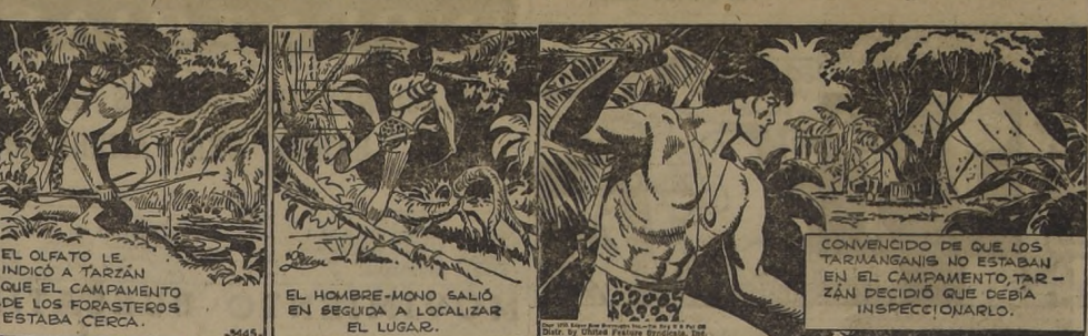
EL OLIFANTE LE INDICÓ A TARZAN QUE EL CAMPAMENTO DE LOS FORASTEROS ESTABA CERCA.

CONVENCIDO DE QUE LOS TARIANGANIS NO ESTABAN EN EL CAMPAMENTO, TARZAN DECIDIÓ QUE DEBIA INSPECCIONARLO.