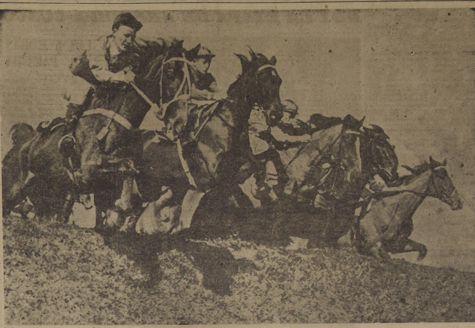
FAMOSO STEEPLCHASE.— En el famoso steeplechase de Auckland, Nueva Zelandia, corrido en la pista de Ellerslie, se registra un instante de emoción cuando cinco caballos pasan en una misma línea uno de los más difíciles obstáculos. Los caballos son Cash Order, Yes Sir, Repayment, Green Light y Master Joe. La prueba, pese a su extensión y variedad de vallas, registró un final sumamente estrecho.

Lunes 27.— Visita del directorio a la Escuela Normal José Abelardo Núñez a las 10 horas y entrega de obsequios deportivos; por la tarde, sesión recordatoria de la fundación del club con asistencia del directorio y socios. Por la noche, partidos finales del torneo interno de pímpon, adultos.