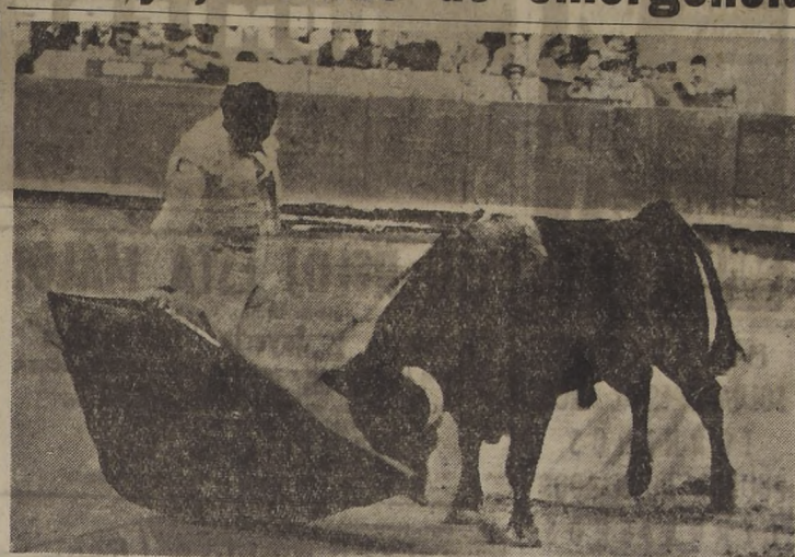
EL TORERO EN EL DIA DE SU "ALTERNATIVA". — BARCELONA. — El torero colombiano César Girón, después de recibir la "alternativa" o "espaldarazo" de manos del famoso torero mexicano, Carlos Arruza, realiza un pase natural con la muleta, al toro que le tocó matar el día que de esta manera fuera consagrado torero profesional en el ruedo de la plaza monumental de Barcelona.