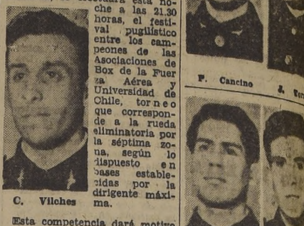
En el ring que se ha levantado especialmente en la cancha de básquetbol que posee el Deportivo Universidad de Chile, en Arturo Prat casi siempre de Alameda, se efectuará esta noche a las 21.30 horas, el festival pugilístico entre los campeones de las asociaciones de Box de la Fuerza Aérea y Universidad de Chile, torneo que corresponde a la rueda eliminatoria por la séptima zona, según lo dispuesto en bases establecidas por la dirigencia máxima.

Esta competencia dará motivo para evaluar a varios elementos y vastamente conocidos del público metropolitaniano, cuyos ganadores tomarán parte en el tradicional campeonato de Chile que organiza la dirigencia nacional de este deporte.