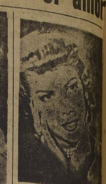
NINON SEVILLA: "El amor es un arte... el mejor y el más difícil".

to, y los incidentes cómicos, ¿lo califican de arte, necesidad, microbio y extraña mezcolanza?