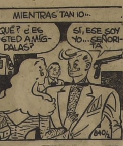
UNA LLAVE FUNCIONA... UNA PUERTA SE ABRE... Y UNA FIGURA ENTRA EN LA CASA...