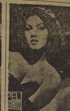
ROSA CARMINA: "El amor es una mezcla fantástica de ternura y pasión".