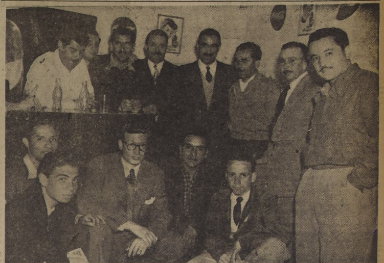
CHILENOS Y PERUANOS.— En los descansos de la esforzada competencia mecánica, volantes chilenos y peruanos se reúnen en amigables charlas...