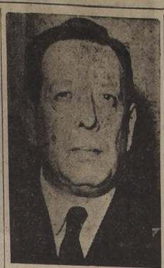
Senador Francisco Bulnes