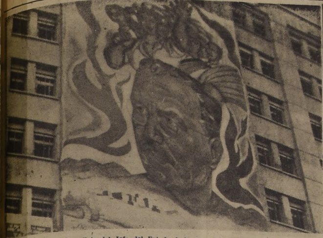
Gigantesco mural de la efígie del Jefe del Estado, bajo el cual un mar humano se desplazó el 15 de noviembre, será hoy retirado del frontis del edificio de la Caja Nacional de Ahorros. En adelante, adornará la sala central de la sede del movimiento ibañista. El mural es obra del pintor chileno Fernando Marcos Miranda.

Si se notara que con esta medida el precio de la manteca aumentaría especulativamente, en vez de bajar, se fijará nuevamente, de acuerdo a los estudios que haga el Ministerio.