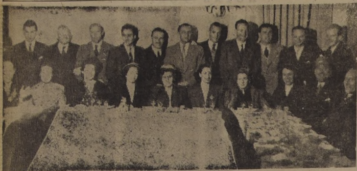
EN EL CHATHAM CLUB DEL DANUBIO AZUL.—Almuerzo ofrecido por el conjunto argentino-irlandés de hockey sobre césped...