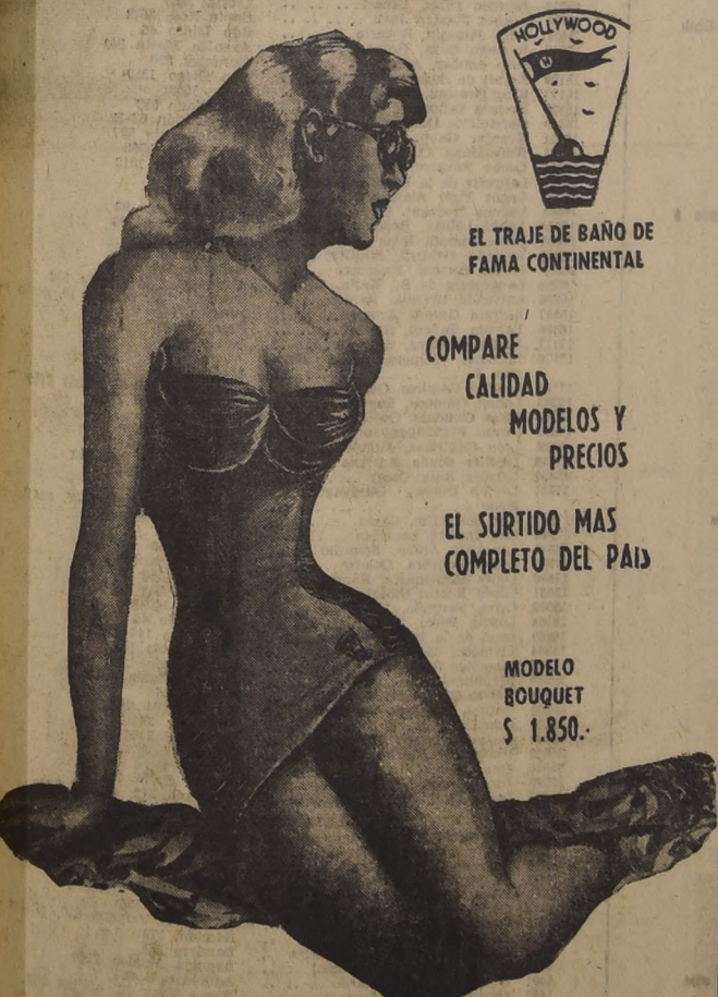
EL TRAJE DE BAÑO DE FAMA CONTINENTAL