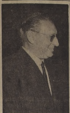
Senador José Maza

Ultima tenso en el liberalismo. — Revuelo causado en las bases de Santiago por la actitud de diputado Barros Torres