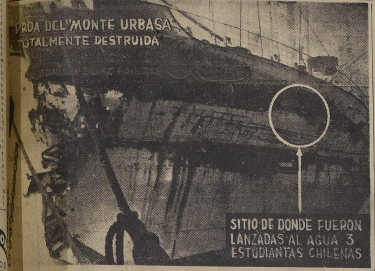
PROA DEL MONTE URBASA TOTALMENTE DESTRUIDA