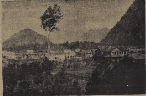
En el grabado se puede apreciar un aspecto de Puerto Aysen, que será visitado por S. E. el Presidente de la Republica, para imponerse personalmente de los problemas que afectan a esta rica zona del país.

La correspondencia se demuestra extraordinariamente. Las comunicaciones telefónicas tienen que hacerse, como es sabido, por radio desde Puerto Aysen a Pto. Montt. El servicio de Correos y Telégrafos no tiene radio propia, de modo que se sirve de la