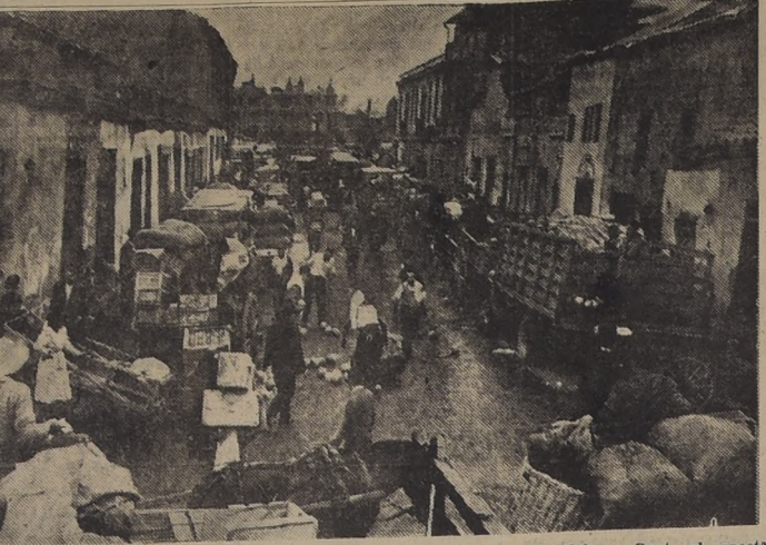
DESORDEN, ANARQUIA Y ESTRECHEZ. — Esta foto vale por mil palabras. Capta el aspecto que ofrece todas las mañanas la calle Salas, al llegar a Recoleta, donde se abre la puerta de entrada de vehículos a la Vega Municipal. La calzada resulta estrecha para el hacinamiento de carretelas, carritos "a mano", camiones, camionetas y todos los medios imaginables de transporte puestas en uso por la inventiva humana. Nadie respeta a nadie. Solo prima el dicho del más fuerte. Junto a los primitivos medios para movilizar los productos de "la buena tierra", la anarquía y el desorden contribuyen en forma notable a elevar el precio de verduras, frutas y hortalizas.

Los alumnos que sortearon las pruebas del bachillerato el martes pasado, deberán rendir hoy su primer examen, correspondiente a filosofía, comprensión y redacción, e idioma. Los demás exámenes los rendirán en las siguientes fechas: Mañana historia y geografía de Chile; lunes 12, prueba especial escrita; miércoles 14, prueba especial oral.