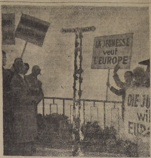
DERRIBANDO FRONTERAS. — VENTIMIGLIA, Italia. — Un grupo de federalistas europeos, que representan a varias naciones, hacen una demostración en el límite franco-italiano de Ventimiglia en favor de la abolición de las fronteras entre los países europeos. Quedan el poste que separa a Francia de Italia.

PARIS, 7.— (U.P.).— (Por Edward M. Korry).— Estados Unidos ha resuelto dar a Yugoslavia una ayuda especial de veinte millones de dólares para hacer frente a la sequía, según se supo en esferas fidalgas. El anuncio oficial sobre esta nueva ayuda al régimen de Tito será hecho probablemente a fines de la presente semana. Los informantes dijeron que esta ayuda será adicional a la de 99 millones de dólares prometida para el régimen yugoslavo por Estados Unidos, Gran Bretaña y Francia, conjuntamente, para el año fiscal de 1952-53. Estados Unidos se comprometió a proporcionar 78 millones de dólares de esta ayuda conjunta, la mayor parte de la cual ya ha sido enviada a Belgrado. La nueva asignación ha sido extendida por Estados Unidos en vista de las graves consecuencias acrecidas por la sequía del año pasado, la segunda sequía grave en Yugoslavia en tres años. Esta última sequía asestó un serio golpe al programa de liberalización del comercio en que se había embarcado la nación después de la excelente cosecha de 1951.