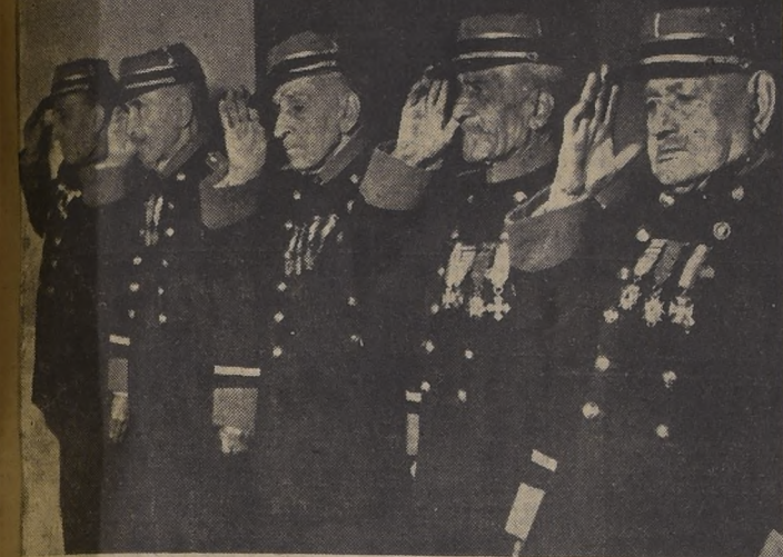
SIEMPRE DEL PASADO HEROICO. — Con una arrogancia marcial que venció a los años, los viejos y gloriosos soldados, luciendo los mismos uniformes que vistieron en la epopeya del 79, se cuadraron en un saludo que más que el seco simbolismo militar posee, también, un honor de ternura humana. Los que aún quedan montando guardia en los recuerdos, saludan a los que ya se fueron, a los que los precedieron en el viaje definitivo. El Día del Veterano, que se celebra hoy, sólo encuentra a 100 veteranos con vida. — (Información en la página 2)

El Ministerio de Economía dictará los decretos respectivos hoy