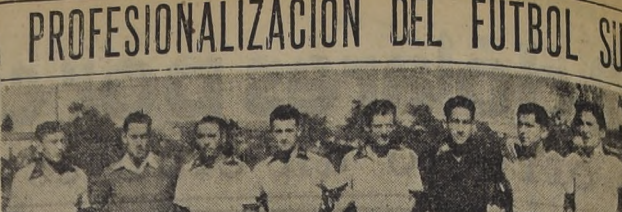
CAMPEON SUREÑO.— Equipo del Naval, de Talcahuano, que nuevamente se clasificó campeón del regional del sur. Ya en 1951 los marinos habían logrado tan honrosa clasificación...