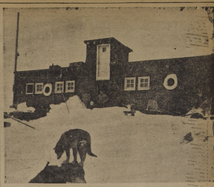
CUARTEL DEL EJERCITO CHILENO EN LA ANTARTIDA. — Este es el cuartel en el que viven durante un año, los siete hombres del Ejército que cubren la guarnición de la Base O'Higgins. El edificio ha sido dotado, año tras año, con las mejores comodidades posibles para su personal. En el grabado aparece rodeado de nieve, destacándose la torre con su elevada puerta que a veces utiliza el personal para salir cuando la nieve cubre gran parte de la edificación que está pintada con alquitrán. En primer término, se ve a dos perros del magnífico criadero que mantiene la base, y que cuenta actualmente con más de 30 animales hábilmente adiestrados para las faenas en la nieve.