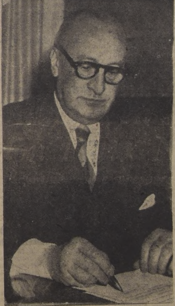
miración y el afecto de todos los americanos, tanto fuera como dentro de los círculos gubernativos, que tuvieron el privilegio de conocerlo. Aquéllos que, como yo, tuvimos oportunidad de conocerlo en el Departamento de Estado, sentí especialmente la pérdida de tan distinguido hombre público chileno.

El Gobierno expresó ayer su profundo pesar