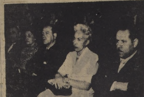
PRIMERA ESCUELA DE VERANO DE LA UNIVERSIDAD TECNICA...

Son los "Últimos de la Fama": hoy rinden homenaje al Soldado Desconocido