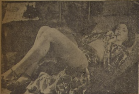
EN TELEFONO Y UN COJIN. — Bastan estos dos artefactos para la comodidad de Rosa Carmina, atractiva y deslumbrante trella de la cinematografía azteca, que tiene un papel singular en la nueva cinta, "Noche de perdición", junto a Carlos Navarro. El estreno será efectivo el próximo martes en la pantalla del cine Santiago.