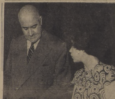
El dictamen de la Contraloría a consulta sobre esta medida adoptada, dice que es nula y que debe aplicarse a quienes la adoptaron, las sanciones contempladas en el inciso 7.º del artículo 20 de la ley N.º 9.918, que establece sanción pecuniaria derivada de tales acuerdos, con los Consejeros o Directores que concurran con sus votos a la aprobación de los mismos e incurrirán en causal de destitución.

La Contraloría General de la República, en extenso informe enviado al Ministerio de Agricultura, establece la ilegalidad del plan de inversiones y fijación de la nueva planta del personal del Instituto de Economía Agrícola, correspondiente al año 1952. El acuerdo del Consejo de INECONA de aprobar esa planta y de aumentar sueldos de algunos funcionarios, junto con carecer de legalidad, hace acreedor a sanciones a los miembros del consejo que, con sus votos, concurrieron a adoptarlo.