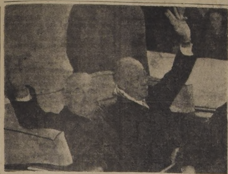
WASHINGTON. — El Presidente Truman (izquierda) y su sucesor, Dwight D. Eisenhower se dirigen en automóvil de la Casa Blanca al Capitolio, frente al cual Eisenhower prestó juramento como Presidente de la Nación, sucediendo a Truman, desde las 12.31 P. M. del 20 de enero.

El embajador británico en Brasil, señor E. Berthoud, rindió homenaje a los cinco mil marineros daneses que sirvieron en las fuerzas armadas durante la guerra, donde perdieron la vida mil y noventa y cinco.