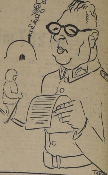
Ministro de Defensa, general don Abdón Parra, quien se encuentra en Punta Arenas para recibir al personal de las Fuerzas Armadas que regresa al continente...