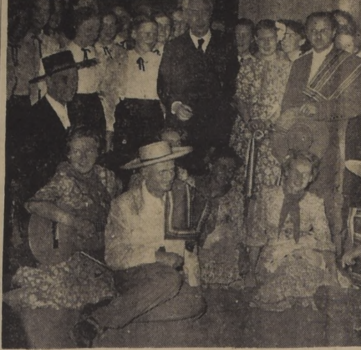
COORO DE CHILENOS EN ALEMANIA OCCIDENTAL. — BONN, Alemania. — El Presidente de la Alemania Occidental, Theodor Heuss, al centro, recibió y agasajó a los miembros del coro chileno, formado por descendientes de alemanes que se radicaron en Chile...