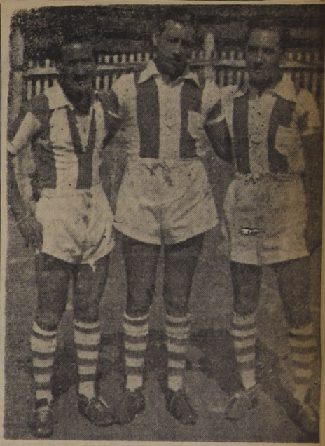
LÍNEA DE CONTENCIÓN Y APOYO del Campeón Mendocino de los Barrios, el "Martín Güemes"...