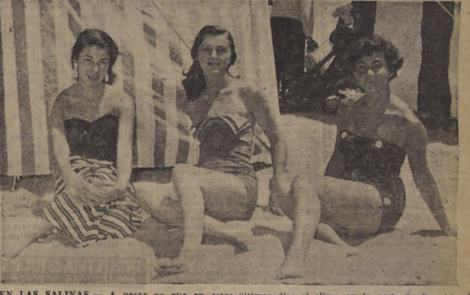
EN LAS SALINAS. A pesar de que en estos últimos días el clima en la costa no ha sido todo favorable para los veraneantes —ha hecho un intenso frío, en medio de un constante nublado—, estas tres muchachas no han trepidado en darse un baño de mar. Sostienen que en Las Salinas o en cualquiera parte, un baño de mar es tan saludable como uno de sol.