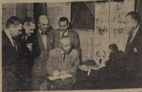
El Comodoro Ibañeta de Ferrovios Exonerados y Jubilados, en un momento de su visita a la planta de Lillo.

Destacó el significado del viaje del General Sr. Juan Domingo Perón