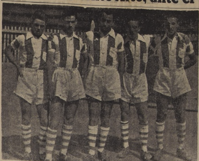
Quinteto ofensivo del "MARTIN GUEMES" DE MENDOZA...