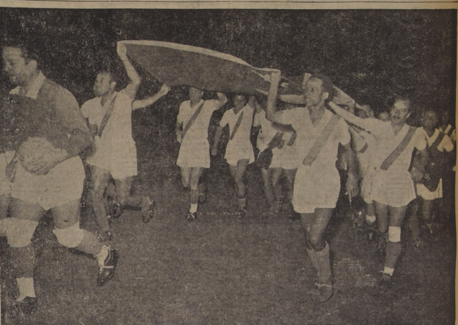
Lo que hay que preguntarse es cuánto costarían hoy estos cracks del fútbol peruano. No habría dinero con qué pagarlos...