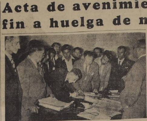
SOLUCIONADO CONFLICTO MOLINERO.— El acta de avenimiento suscrita ayer por los obreros y la Asociación de Molineros del Centro, en el despacho del Ministro del Interior, puso fin a la huelga...