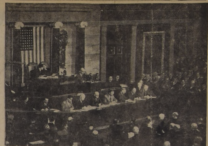
EISENHOWER LEE SU PRIMER MENSAJE DEL ESTADO DE LA UNIÓN.— WASHINGTON.— Por primera vez, como Presidente de la República Dwight D. Eisenhower lee su mensaje sobre el Estado de la Unión, ante el Congreso Pleno. Detrás del Primer Mandatario están, de izquierda a derecha, el Vicepresidente de la nación y presidente del Senado, Richard M. Nixon, y el presidente de la Cámara de Representantes, Joseph Martin, quienes presidieron la sesión conjunta.— (Foto United Press)

3.— Las liberales opiniones de Eisenhower sobre la igualdad racial y los derechos civiles son un importante factor "impalpable" que resultará beneficioso para las relaciones de Estados Unidos con algunas repúblicas americanas. 4.— La declaración del Presidente Eisenhower en el sentido de que Estados Unidos recibirá, un intercambio equitativo, mayores cantidades de importantes materias primas que Estados Unidos no produce, deja abierto el camino para futuras negociaciones interamericanas sobre numerosos artículos estratégicos de importancia, tales como manganeso y hojalata. Desde el punto de vista latinoamericano, ninguna de las propuestas presidenciales al Congreso ofrece ventajas, y la mayoría de ellas podría citarse en el futuro para respaldar los programas de fomento y cooperación técnica. Por tanto, la impresión neta en los circuitos latinoamericanos es que el nuevo gobierno ha establecido un patrón general favorable a las relaciones interamericanas, aunque todavía no se ha desarrollado totalmente en términos de programas específicos o de organización administrativa.