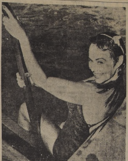
¿QUIEN DIJO QUE NO HABIA SIRENAS?— PALM SPRINGS, California.— La famosa actriz del cine Paulette Goddard nos reñe, metida en un transparente traje de baño, como una verdadera sirena moderna.