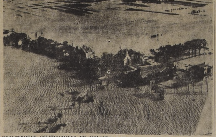
DESASTROSAS INUNDACIONES EN HOLANDA. 1.200 muertos. — ISLA DE WALCHEREN, Holanda. — Vista aérea de la isla de Walcheren, que fue una de las zonas más devastadas por las inundaciones que ocasionaron más de 1.200 muertos en toda Europa. El desastre no ha tenido paralelo en el continente europeo.

Declaraciones de Adenauer, después de la entrevista