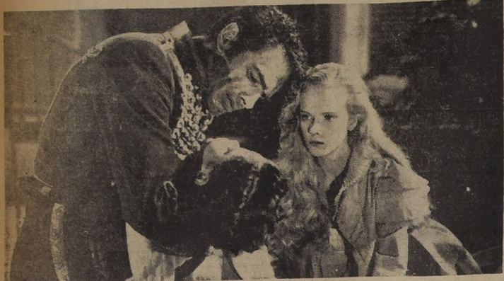
CHARLES KORVIN y ANNE FRANCIS, en una dramática escena del espectacular film filmado en los hermosos parajes de Haití, con el ruido cesar de los tambores del Vudú, aventuras, misterio e intrigas, en el éxito que la Fox nos presenta el JUEVES en el REX.

Con Dale Robertson, Anne Francis y Charles Korvin