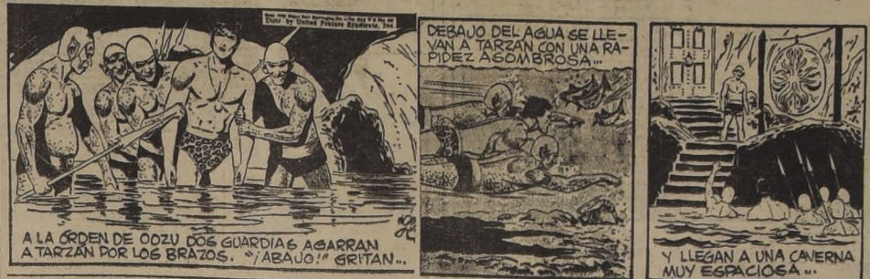
A LA ORDEN DE OZU DOS GUARDIAS AGARRAN A TARZAN POR LOS BRAZOS. "¡ABAJO!" GRITAN... DEBAJO DEL AGUA SE LLEVAN A TARZAN CON UNA RAPIDEZ ASOMBROSA... Y LLEGAN A UNA CAVERNA MUY ESPACIOSA...

Por Lino Palacio JESUS NO COME NUNCA SALPICÓN EN SU CASA... ...PORQUE SABE COMO LO HACEN ¿Y EN EL RESTAURANT LO COME? ¡CLARO! PORQUE DICE QUE NO SABE COMO LO HACEN