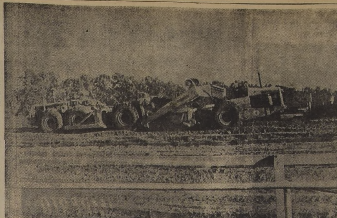
A TODO VAPOR están trabajando estas modernas máquinas excavadoras, a fin de tener lista para abril la nueva pista del Club Hípico de Santiago.

HIPODROMO CHILE JUEVES 5 DE FEBRERO Pista de arena de subida. HOLY MOSES. — E. Soto. — Pasó 1.000 metros en 1.3 2/5.