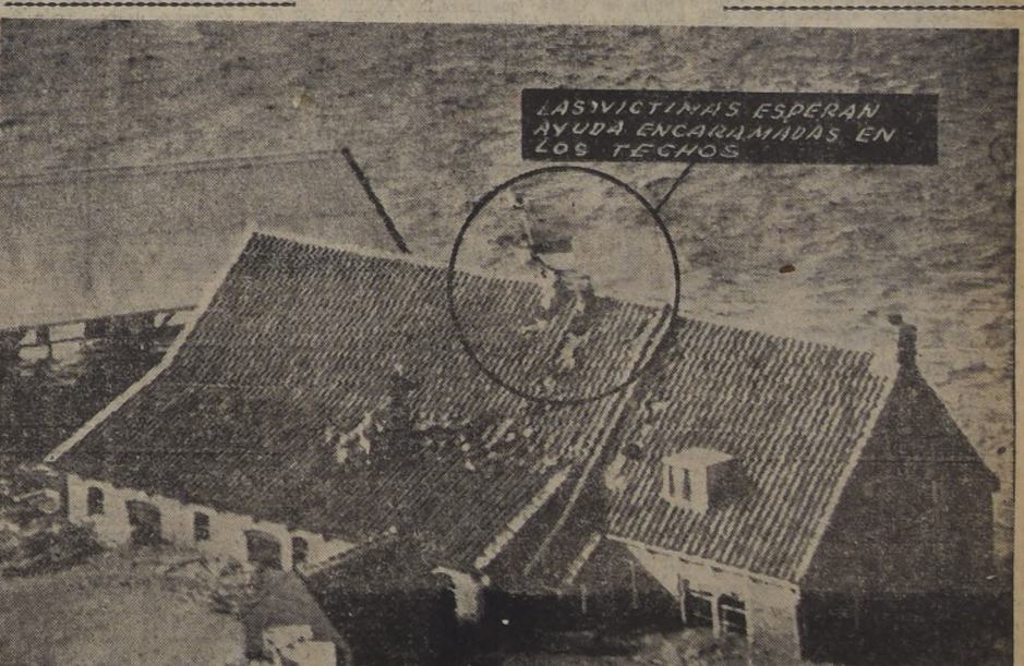
LAS VICTIMAS ESPERAN AYUDA ENCARAMADAS EN LOS TECHOS

DESOLACION Y MUERTE EN EL OESTE DE EUROPA.— Cuando la isla Walcheren (Holanda), fué inundada por el mar a raíz del más grande huracán que haya sopotado Europa Occidental en toda su historia, se produjeron escenas como la del grabado de arriba, en donde miles de animales murieron ahogados en las aguas. Entretanto, las víctimas de la inundación en esta misma aldea (grabado de abajo), se han encaramado en los techos de sus casas en espera de ser salvados. Los temporales produjeron un saldo de más de 1.200 muertos en los cinco países que fueron azotados por la furia de la naturaleza durante cinco días.