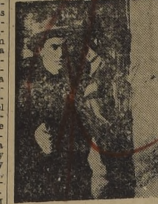
Los famosos hermanos James, que se destacaron en su época por su audacia y brutalidad...