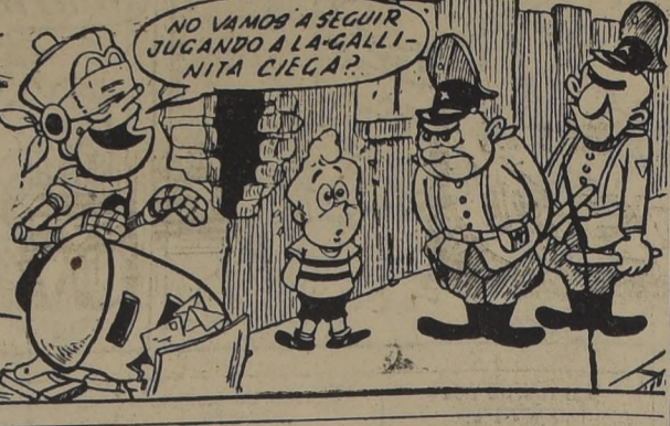
NO VAMOS A SEGUIR JUGANDO A LA GALLINITA CIEGA.