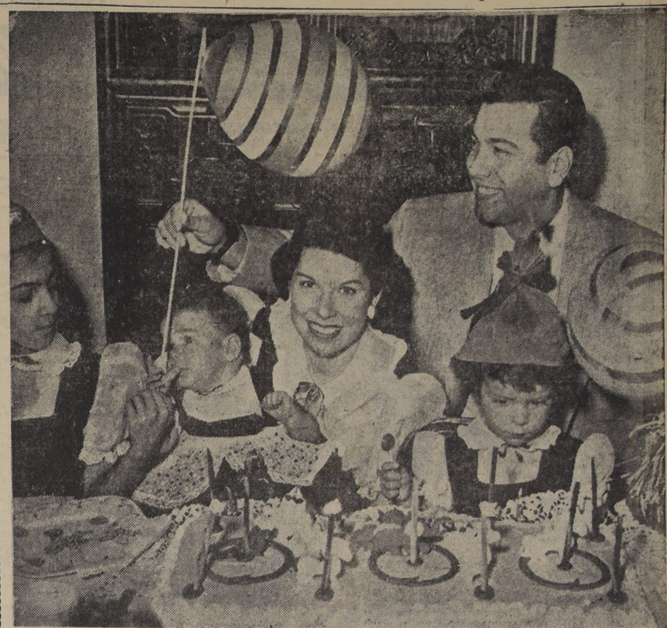
EN HERSHEY, comunidad de cinco mil habitantes, todos son felices. Tienen escuelas, juegos y teatros donde actúan las principales figuras de Broadway. Por cierto que no hay niños que deseen una barra de chocolate. Sobra. Y las fiestas, como ésta, tienen el dulce encanto de ese manjar exquisito.