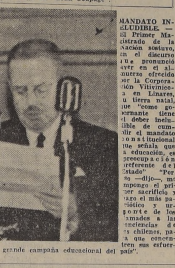
El General Ibanez en la m3s grande campaa educativa del pais.