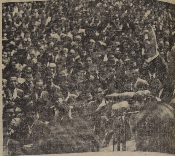
S. E. SE DIRIGE AL PUEBLO DE LINARES. — El Presidente de la República, don Carlos Ibáñez del Campo, habló ayer al pueblo de Linares, desde un tablón construido en la Intendencia. Miles de personas llenaban la plaza de la ciudad. S. E. se refirió a obras públicas, como también al problema escolar. En el grabado vemos al jefe del Estado haciendo uso de la palabra, ante los miles de ciudadanos que lo escuchaban.

PELEQUEN. — Desde 1929 en que se construyó con material gero un edificio de emergencia en terreno fiscal, funciona hasta la fecha, el Correo y Telégrafo de esta localidad, sin que reúna la condición de seguridad y comodidad para la atención que tales servicios merecen en una