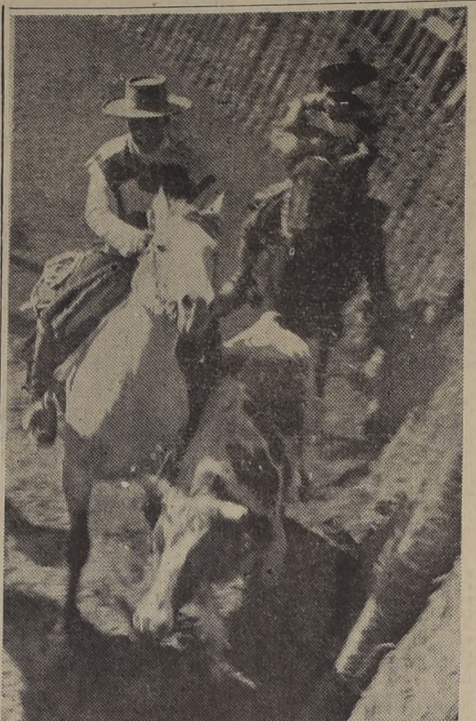
CHAMPION DE CHILE. — La amplia y acogedora medialuna de la Quinta Normal será escenario, a fines de mes, del Rodeo de Exposición de Caballares Corraleros y Champion de Chile...