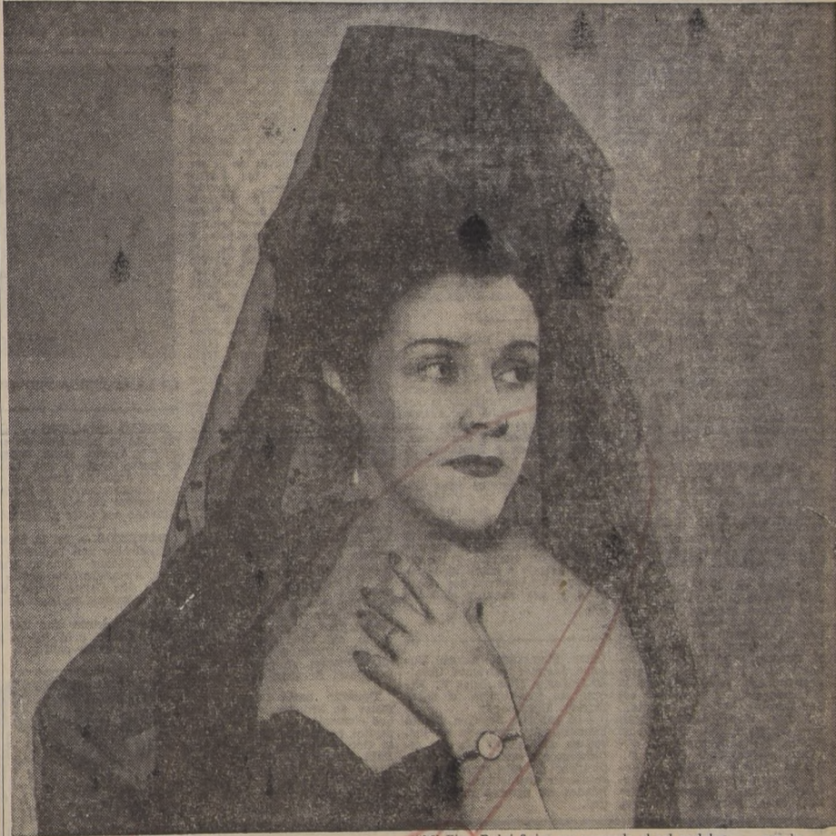
"Mi Fino Reloj Suizo me recuerda el sol andaluz... por lo exacto y bonito" —dice Imperio Argentina, salerosa reina de la canción. "El relojero me lo dijo: es mejor un Fino Reloj Suizo."

Los relojeros aseveran que... ¡Es mejor un Reloj Suizo Fino!