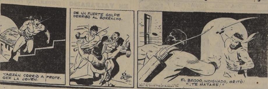
TARZAN CORRER A PROTEGER LA JOVEN. EL BEUDO, INDIGNADO, GRITO: "TE MATARE!"