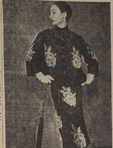
ALGO NUEVO Y ALGO VIEJO. — PARIS. — El pequeño punto de la abuelita tiene aquí el crédito de nuevo en manos del diseñador parisien De Givenchy, quien ha convertido este estilo antiguo en un elegante vestido de tarde, con grandes rosas y brillantes hojas verdes estampadas sobre una tela simple negra con adornos de terciopelo, también negro.

La persona que al cambiar de posición social, de cargo o fortuna, se ve situada de pronto en un plano superior con relación a su existencia anterior, ha de tratar a sus amistades y relaciones en idéntica forma que antes; de lo contrario se le juzgará, y con razón, de vanidosa e "inflada" por la transformación.