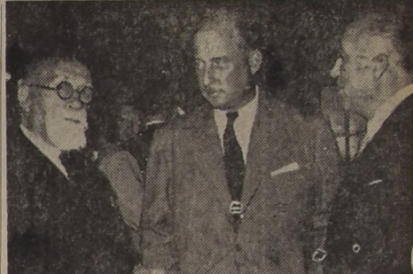
El directorio de la Sociedad Anglo-Chilena, ofreció ayer un coctel en honor del vicepresidente vitalicio de la institución...