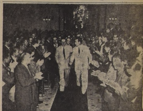
BUENOS AIRES.— El Presidente de la República, General don Juan Domingo Perón, es recibido por el Rector de la Universidad Obrera Nacional, señor Cecilio Conditi, al llegar a la sede de dicho establecimiento de estudios, donde pronunció una inagural alocución con motivo de iniciarse los cursos. (Foto de Agencia Latina).