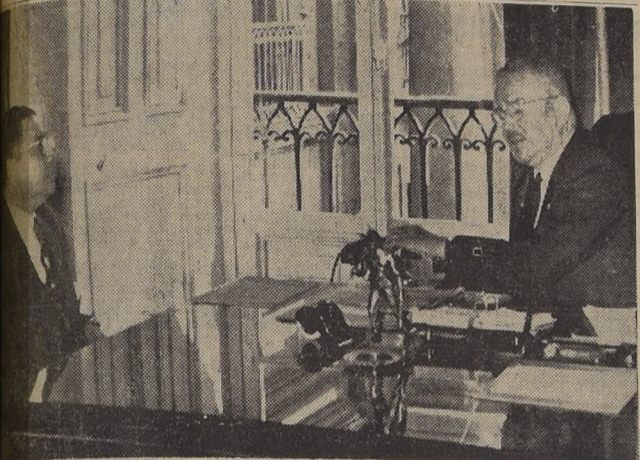
MINISTRO MORINIGO RETRIBUYE VISITA DE S. E.— El ex Presidente del Paraguay, don Morinigo, conversa cordialmente con el Jefe del Estado, Excmo. señor Ibáñez del Campo, retribuyó ayer la visita que éste le hiciera hace años en su patria. Durante esta, se trataron importantes materias que tienen relación con ambos países y que demuestran los efectivos vínculos de sólida amistad que los mantienen unidos.