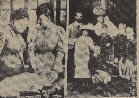
LONDRES.— Estas dos fotografías históricas cobran actualidad, con motivo de la muerte de la Reina viuda María, de Gran Bretaña, que fue anunciada ayer. En la de la izquierda, la entonces Princesa de Gales y más tarde Reina María (derecha), muestra su primer hijo, en 1894, a su madre, la Duquesa Adelaida de Teck. Este primer hijo fue más tarde el Príncipe de Gales y Rey Eduardo VIII, y en la actualidad, el Duque de Windsor, después de renunciar al trono.— A la derecha, la Reina María está con su esposo, el Rey Jorge V, y sus hijos de izquierda a derecha: la Princesa María, el Príncipe Enrique (sentado) y el Príncipe Jorge. A la extrema derecha, está el niño que más tarde fue el Rey Jorge VI, y el segundo de la derecha, es el Duque de Windsor, ex Eduardo VIII. En sus brazos tiene la Reina María al Príncipe Juan Carlos, quien murió en 1919. Esta fotografía fue tomada en 1906.

LONDRES, 24 (UP).— La distinguida anciana de cabellos grises que, a lo largo de su vida, fue una constante presencia en la vida pública británica, murió ayer en su casa de la calle, con ayuda de una escalera de pintor, tenía un ojo dolorosamente herido. Las pocas personas que se congregaron frente a su coche y al camión con que éste chocó la reconocieron y exclamaron alóntas: "¡la Reina María!" y se ofrecieron a ayudarla. Pero ella les dijo sencillamente: "Quisiera una taza de té. No necesito nada más". Frisaba entonces los 85 años, y su salud del trazo con su dignidad tan incólume como siempre, demostró, una vez más, el temple de su carácter, que le conquistara la admiración y respeto de propios y extraños. En 1926 perdió a su esposo, Jorge V. Ese mismo año, su hijo favorito, hoy Duque de Windsor, la hizo divorciar, y ella se casó con el príncipe Enrique, con el que se casó en 1923. En 1936 volvió a casarse con el príncipe Enrique, con el que se casó en 1923. En 1936 volvió a casarse con el príncipe Enrique, con el que se casó en 1923.