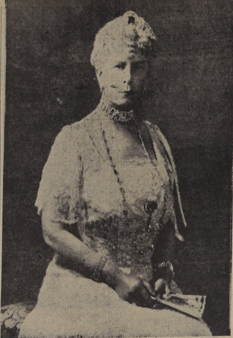
LONDRES.— Esta fotografía de la Reina viuda María de Gran Bretaña, cuyo fallecimiento se anunció ayer, fue tomada oficialmente el 19 de febrero de 1936. Su marido fue el Rey Jorge V, fallecido en enero de ese mismo año. El gran parecido entre la Reina María y su nieta, la actual Reina Isabel II, es claramente visible en esta pose fotográfica. La Reina María dejó de existir a los 85 años, después de haber estado enferma de un prolongado trastorno gástrico.—.