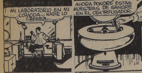
MI LABORATORIO EN MI COMODA... NADIE LO CREERIA...