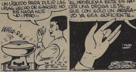
UN LIQUIDO PARA PULIR LAS URJAS HECHO DE SANGRE NO ES NADA NUEVO... PERO...