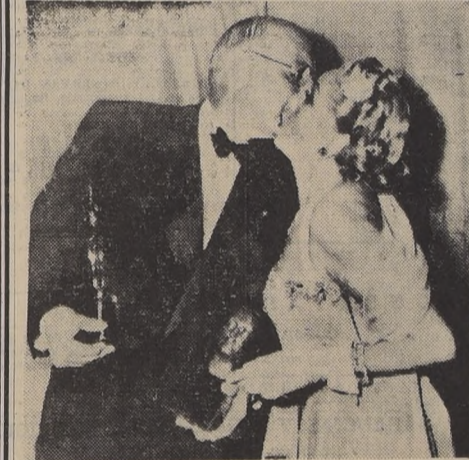
HOLLYWOOD.— Cecil B. De Mille recibe como premio un beso de parte de la famosa actriz del cine mudo, Mary Pickford, después que ella misma le hizo entrega del "Oscar" ganado por él, como asimismo del Premio "Irving Thalberg", por haber sido reconocido como el mejor productor del año pasado por su última película: "El más grande espectáculo del mundo", film épicamente, calificado como el mejor del año.

No olviden desde hoy miércoles quedan inauguradas oficialmente nuestras ventas al detalle.