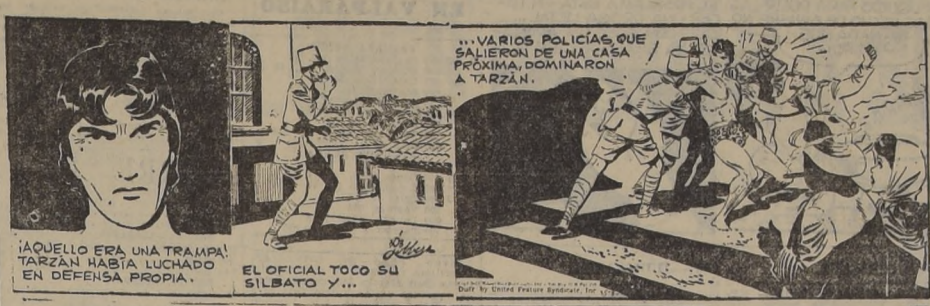
¡AQUELLO ERA UNA TRAMPA! TARZAN HABIA LUCHADO EN DEFENSA PROPIA.