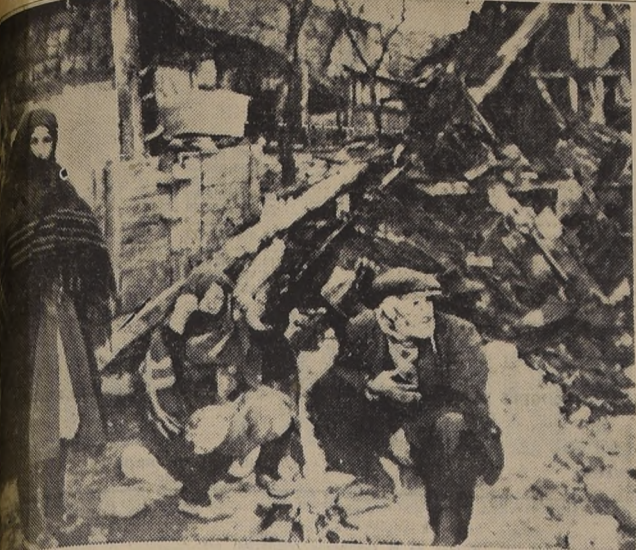
MEMBRAS DE UNA FAMILIA TURCA...