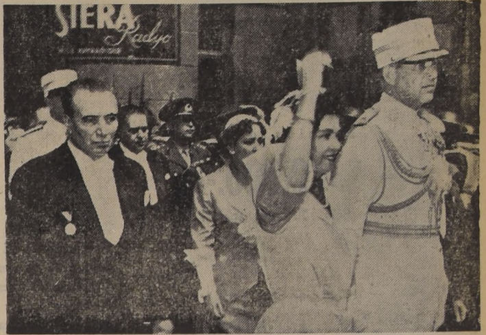
LA REALEZA GRIEGA ESTABLECE UN PRECEDENTE. — ANKARA (Turquía). — El Rey Pablo y la Reina Federica de Grecia, establecieron un precedente al ser los primeros reyes que hayan visitado a Turquía hasta la fecha. A la izquierda camina el Presidente del Parlamento turco, Refik Koraltan, quien los recibió en la estación ferroviaria.