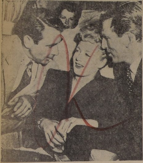
Gary Merrill, Shelley Winters y Michael Rennie, principales intérpretes del drama que ha conmovido a todos los públicos en sus exhibiciones del CINE REX, al iniciar ayer su segunda semana de triunfales exhibiciones.

Sigue el éxito en el Rex, del drama que conmueve a Santiago: "Llamada de un extraño"