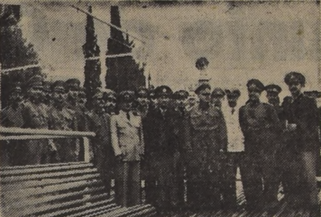
BUENOS AIRES. — Los oficiales de la Escuela Politécnica de Chile que visitan Argentina fotografiados con motivo del paseo que realizaron ayer por las islas del Tigre en compañía de sus colegas argentinos.

Esta será la primera aparición de Navarra en un torneo mundial desde 1948, cuando siguió en segundo lugar a Willie Hoppe, actualmente retirado. Solo un ex campeón mundial,