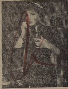
La actriz-cantante Libertad Lamarque interpreta a Elena, una mujer buena y abnegada, que lucha por defender la felicidad de su hogar y de sus hijos, en la película de Filmex "TE SIGO ESPERANDO", bajo la dirección de Tito Davison.