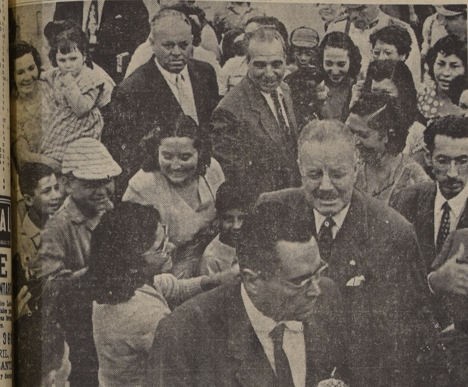
General Ibáñez con los pueblos del norte. — Las aspiraciones, anhelos, problemas y esperanzas de los habitantes de los pueblos del norte, las captó personalmente el Presidente de la República. Una vez finalizados los actos oficiales, el Jefe del Estado recorrió los diversos barrios de Antofagasta, Iquique y Arica. Sencillo, cordial y siempre atento a los problemas humanos, habló con su pueblo la solución de sus aspiraciones inmediatas. En el rostro de los niños que rodean al General Ibáñez, se advierte la fe con que se acercan hasta él, para hacerle llegar sus infantiles y expresivos saludos de bienvenida.