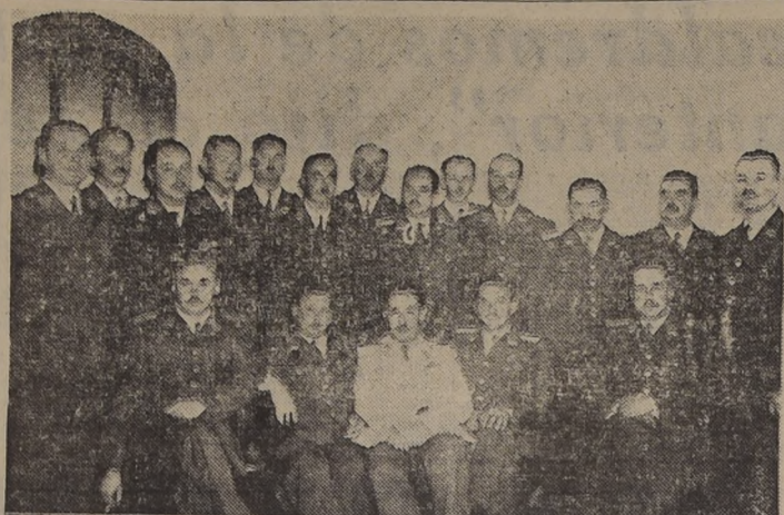
TREINTA CAPITANES DE CARABINEROS REUNIDOS EN SANTIAGO - Intenta capitular de Carabineros, venidos de todos los lugares del país, se han reunido en la capital para celebrar sus...