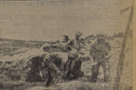
FRENTE DE COREA.— Soldados de las fuerzas de infantería de marina de los Estados Unidos dieron muerte o hirieron a 63 chinos comunistas en una batalla librada a 1.600 metros de Panmunjom...