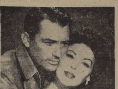
AVA GARDNER, que supo levantar un volcán en el corazón de Gregory Peck.