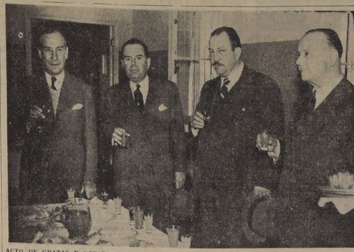
ACTO DE AGRADECIMIENTO Y NOBLES PROYECCIONES.— En el grabado un aspecto de la inauguración de la Sala de Entrenamientos del Departamento de Bienestar Social del Club Hípico de Santiago.

PRIMERA CARRERA.— 1.100 metros CONDICIONAL MONTECORAL 56. (J. E. Bravo). No hace mucho se clasificó cuarto de Cuartón, Folke y Lamblón, performance que le asigna su narigada de chance.