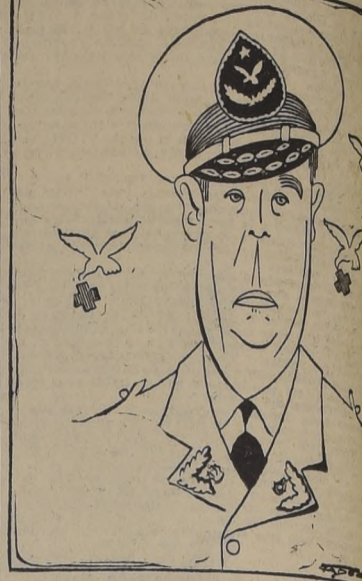
General de brigada, cirujano don Agustín Latorre, rindieron homenaje por sus 30 años de labor, toda la guarnición de El Bosque.