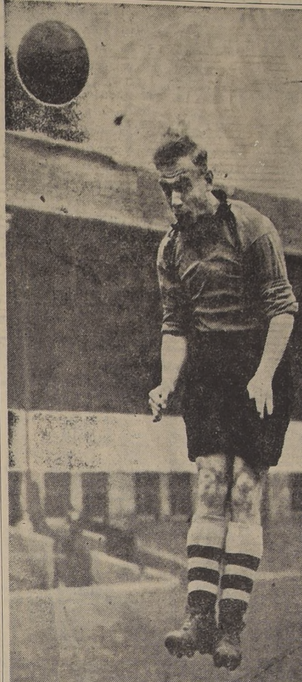
BILLY WRIGHT, trae en esta jira por Sudamérica una distinción a la cual deberá responder: es el jugador que más veces ha integrado la Selección Inglesa. En su club, es half izquierdo, pero en el combinado formará a la derecha. Trae además, la capitania del conjunto.

EXPECTACION. — Así están las cosas frente a la primera presentación de esta jira que cumplen los ingleses por América del Sur. El partido del jueves servirá para ir tirando líneas acerca de lo que harán los demás equipos que los enfrentarán. Especialmente en el caso nuestro. Por lo menos tendremos una referencia más cercana y habrá tiempo, además de adoptar las precauciones a que hubiese lugar. Por otra parte, el match internacional de pasado mañana en el Estadio de River Plate de Buenos Aires, señala toda una época en la historia del fútbol continental. Cincuenta años más tarde, los argentinos tienen la pretensión de demostrar a sus maestros que las enseñanzas que ellos dejaron en los albores del siglo no fueron desaprovechadas. Por el contrario, se empequeñecieron ante la asimilación rápida y siempre asombrosa que hicieron sus aprovechados alumnos.