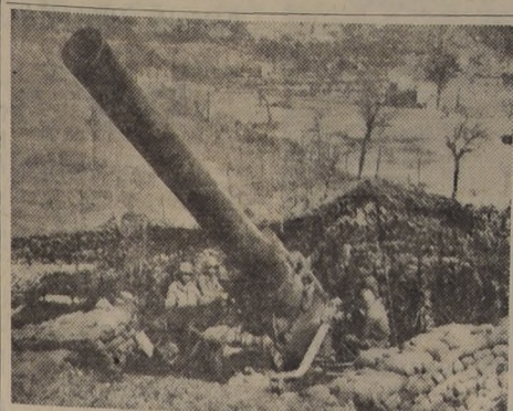
GIGANTESCO Y POTENTE CANON EN COREA. — COREA. — El Ejército reveló que este cañón en Corea está ya haciendo estragos entre las filas comunistas. Se trata de un cañón gigante de 24 kilómetros de distancia. Es howitz de 240 milímetros de calibre, que estuvo en acción en Italia en 1944. El cañón atómico es el único que le supera en tamaño.

TOKIO, sábado 16. — (U. P.). — Cerca de trescientos cazas y bombarderos de las Naciones Unidas realizaron un ataque de destrucción contra los centros de instrucción del Ejército Rojo, que quedaban cerca de la ciudad de Chinampo. Esta ha sido la ciudad aérea más devastadora de los últimos meses.