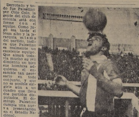
Derrotado y todo fue Palestino por Colo Colo, la gente del club de colonia está con el ánimo...