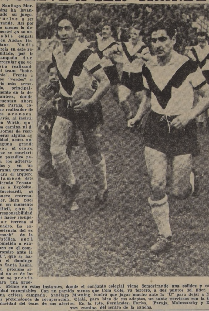
Santiago Morning ha levantado su juego. Y vuelve a ser grande. Así por lo menos lo demostró en su notable empate con Audax Italiano...