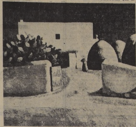
Cuadro de Miguel Villa, nacido en Masnou de Barcelona, que comenzó a pintar en 1922 en Francia, para luego intervenir en exposiciones internacionales, estando representado en los museos de Barcelona. Esta firma acompaña a la de 130 artistas incluidos en la Bienal Hispanoamericana, que se exhibirá en la Feria de Productos de España, a inaugurarse hoy.

te de la banca, que ha estimulado y ayudado al desarrollo progresivo de los proyectos de industrialización del país. En este aspecto del comercio de exportación e importación, no puede olvidarse la intensa labor que vienen desarrollando las operaciones descentralizadas, que as-