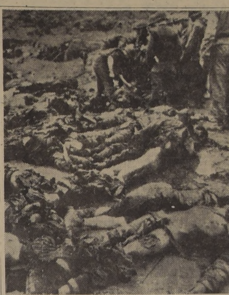
COREA. — YA TODO TERMINO PARA ESTOS SOLDADOS. — La ferocidad de los ataques comunistas en la avanzada "Harry" en el frente central coreano, aparece aquí siniestramente ilustrada, por los cadáveres mutilados de los soldados rojos y de la NU, tendidos sobre el campo de batalla en un espantoso cuadro de muerte.