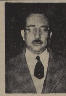
CLODOMIRO ALMEYDA, destacado militante del Partido Socialista, ex Ministro del Trabajo, que prestará juramento como Ministro de Minas.