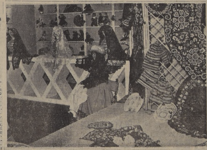
PRODUCTOS TIPICOS DE ESPAÑA. — El grabado muestra un rincón de motivos típicos españoles, uno de los tantos aspectos pintorescos que comprenderá la Feria-Exposición de Productos Españoles que hoy será inaugurada con asistencia del Presidente de la República, Ministros de Estado, diplomáticos y altos funcionarios del Gobierno y que permanecerá abierta al público durante un mes y medio.

Hoy será inaugurada la Feria-Exposición de Productos Españoles, torneo de gran envergadura, que es auspiciado por el Gobierno de España, con el apoyo del nuestro, y cuyo objetivo fundamental es promover, mediante el mejor conocimiento del avance productivo de la Madre Patria, un mayor intercambio comercial y cultural entre ambos países.