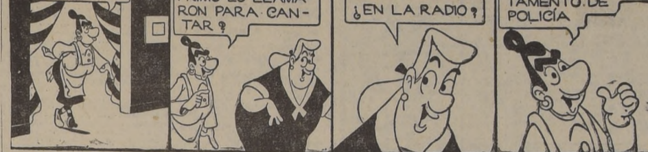
RAMONA Por Lino Paiciao