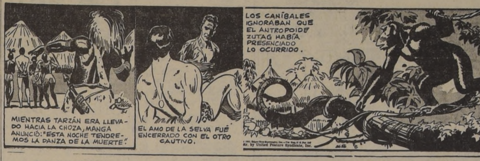
MIENTRAS TARZAN ERA LLEVADO HACIA LA CRUZA, MANGA ANUNCIÓ: 'ESTA NOCHE TENDREMOS LA PANZA DE LA MUERTE'