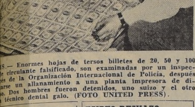
Enormes hojas de tenses billetes de 20, 50 y 100 dólares, descubiertas por un inspector de la Organización Internacional de Policía, después de un allanamiento a una planta impresora de billetes en un campamento de prisioneros en el este de Alemania.