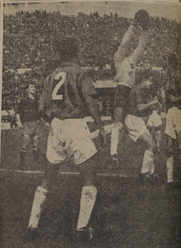
SALIDA OFORTUNA. — Es la que hace Escutti para cortar un centro alto que esperaba Venancio. El meta chileno se afirma en su compañero Farias, en tanto que observan Valjalo con el N.º 2. Al fondo, se ve al crack Kubala. No se afirmó nunca la defensa chilena a la labor desahogada de Valjalo y Cortés, quedando la mitad de la cancha a disposición de los españoles