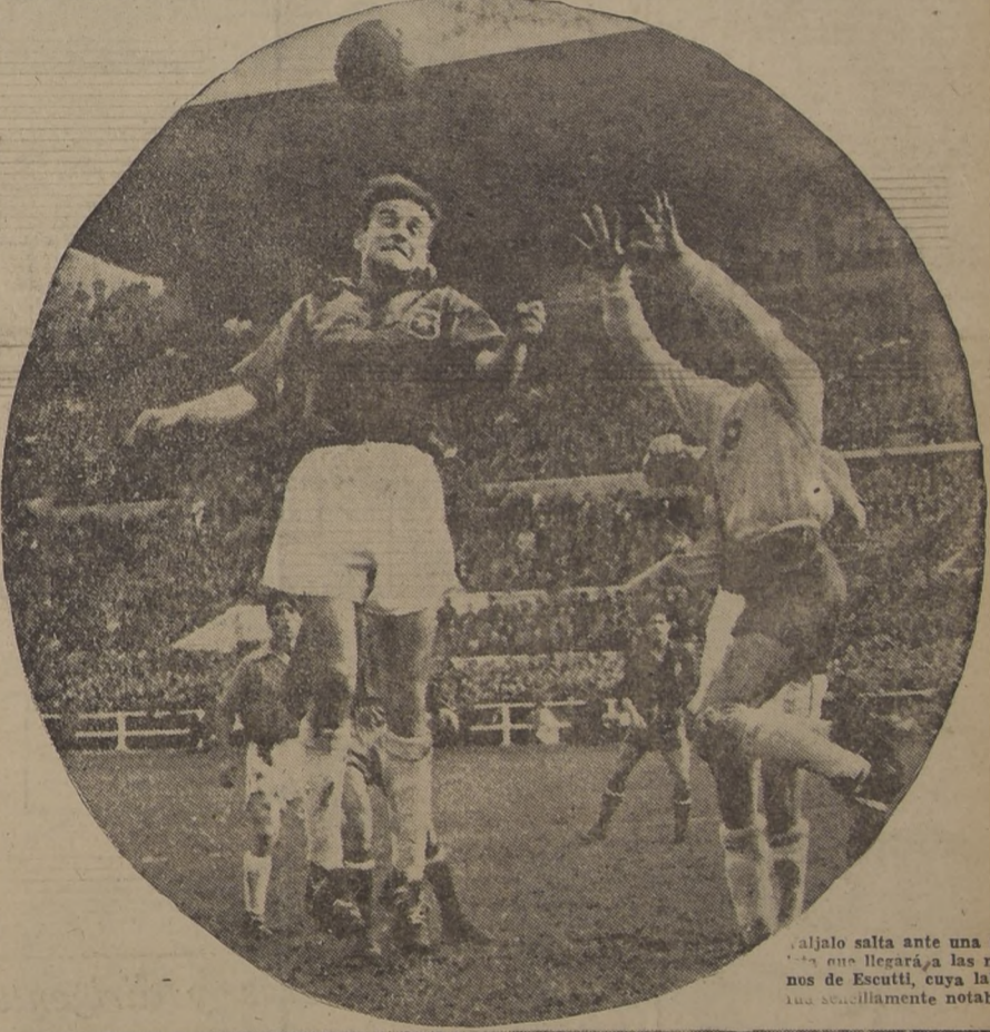
Ramallets salta ante una pelota que llegará a las manos de Escutti, cuya labor fue sencillamente notable.