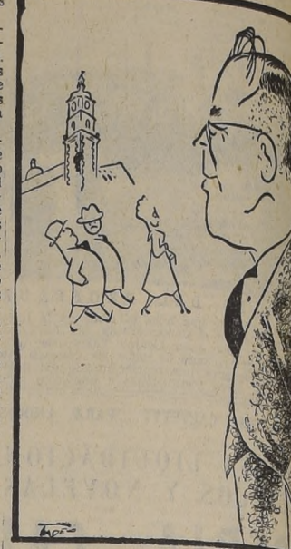
El doctor MILTON EISENHOWER, quien llegará a Chile en una visita de buena voluntad.