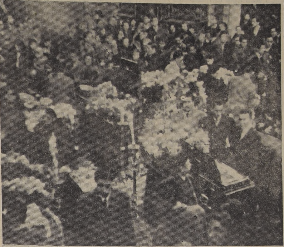
DOLOR COLECTIVO ANTE LA DESGRACIA DE LA CORDILLERA

Miles de personas, en plácida peregrinación, han llegado hasta el Templo de la Graciosa Nacional, donde reposan en severas urnas de color negro, forradas en raso blanco, los cadáveres de una docena de jóvenes estudiantes del Liceo "Juan Bosco". Hasta la medianoche, dos largas columnas que se desfilaban desde la Alameda Bernardo O'Higgins y desde la Avenida Cumming, llegaban hasta la Iglesia, integrada por personas de todas las clases sociales, de ambos sexos, y de diferentes edades, a rendir su tributo de dolor colectivo. Sobre las urnas pudimos advertir algunas prendas andinistas de los infortunados estudiantes. El Templo está cubierto de negros crespones, y sólo pueden verse débilmente iluminados un gran cuadro de María Auxiliadora, otro de San Juan Bosco y el altar de la Virgen del Carmen, adornado por dos banderas chilenas. En medio de las urnas atestadas de coronas, había mesitas con inyecciones y medicamentos para atender a las personas que impresionadas por la magnitud de la tragedia, no han podido contener el control de sus nervios. Las lágrimas brotan de los acorazonados visitantes, mientras Padres Capuchinos rezan oraciones. Carabineros, dentro y fuera de la Iglesia, ordenan las interminables filas que se organizan en la mañana y continúan hasta la madrugada.