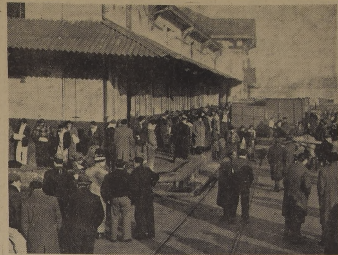
LA CIUDAD SIN CARNE. Sufriendo la inclemencia de la helada matinal, las personas que participan de las faenas diarias del Matadero, estuvieron inactivas en la mañana de ayer...