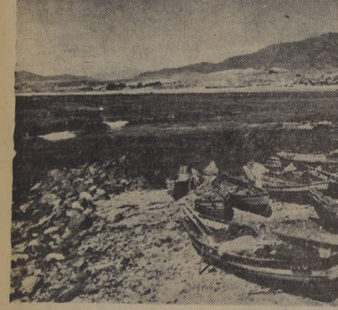
Al fondo los terrenos donde se levantará el hermoso balneario de Los Vilos. En la playa los botes de los pescadores.

Con una solemne ceremonia fue celebrada la colocación de la primera piedra.