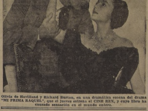
Olivia de Havilland y Richard Burton, en una dramática escena del drama "MI PRIMA RAQUEL", que el jueves estrena el CINE REX, y cuyo libro ha causado sensación en el mundo entero.