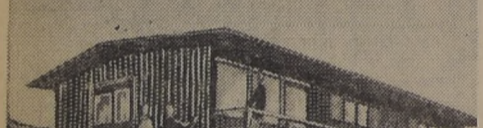
Uno de los modelos de las CABINAS AMERICANAS que se construirán en este balneario.

Con una ceremonia que reunió a todos los habitantes del puerto de Los Vilos y a numerosas personas que fueron especialmente desde Santiago, Iquique y otras ciudades, se colocó ayer la primera piedra de las 27 cabinas, tipo americano, que la firma Arturo Pérez de Arce Jaramillo & Cia., de acuerdo con la Sociedad Turismo Norte Ltda., proyectada para ser entregadas para su uso a fines del mes de diciembre próximo.