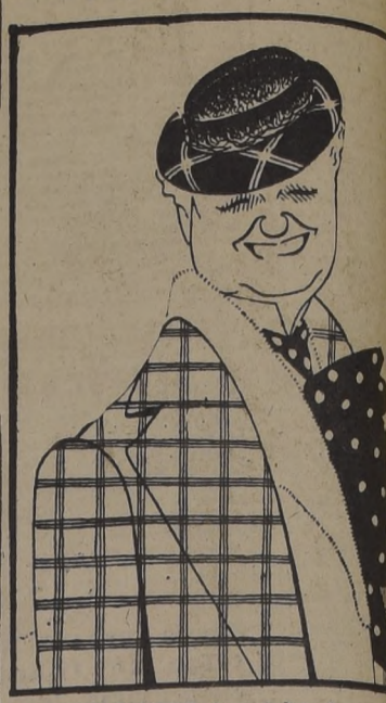
GENEVIEVE TABOUIS, la periodista francesa...