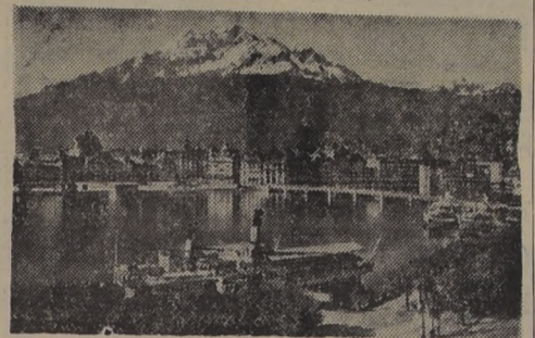
LUCERNA, es una de las más bellas ciudades de Suiza. Queda sobre el lago que lleva su nombre, y es visitada por miles de turistas que llegan de todas partes del mundo.

Para toda Suiza es, sin duda, de interés saber cómo funciona esta vigilancia de las vías férreas que atraviesan nuestro país de Sur a Norte. El Comando del ejército sigue con suma atención la evolución de los eventos militares. Acostumbrado a contar con todas las eventualidades, no ha tardado un solo día para crear un dispositivo de seguridad para prevenirse de cualquiera sorpresa, no importa de qué lado viniera.