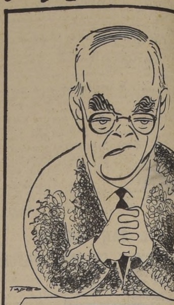
FOSTER DULLES, Secretario de Estado norteamericano, viajando a Corea para entrevistarse con Syngman Rhee.