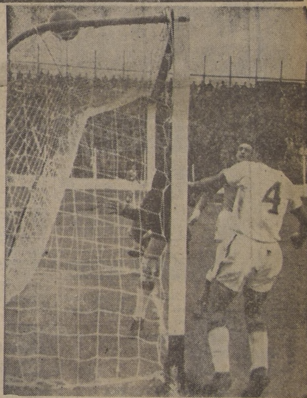
¡GOL DE LA "U"!— Avilés, arquero de Green Cross, es vencido por Gaete. Ganó la "U" 2-1.