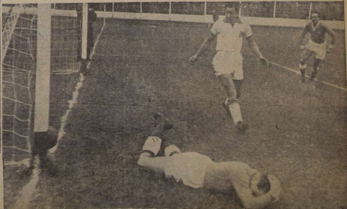
MUSO conquista el 1.er gol para la "U" y queda tendido frente al arco del G. Cross. Salinas se acerca, pero ya no hay caso...