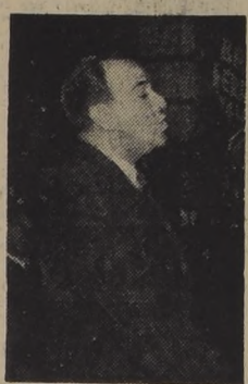
Don JAVIER LIRA MERINO, combativo diputado agrariolaborista, fustigó a la oposición, durante su brillante intervención de ayer, en el Teatro Arica, de Valparaíso.

Enthusiasta y desbordante concurrencia, repleta ayer las concentraciones públicas organizadas por la Unión Nacional del Pueblo (UNAP), para explicar, a lo largo del país, el Plan Económico que ha puesto en marcha el Gobierno del Presidente Ibáñez.