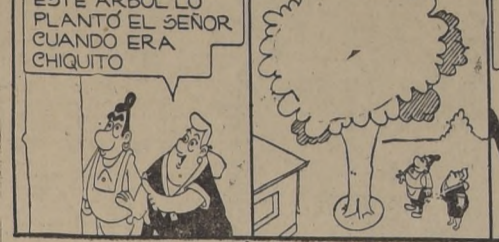
ESTE ARBOL PLANTO EL SEÑOR CUANDO ERA CHIQUITO