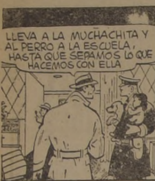
LLEVA A LA MUCHACHITA Y AL PERRO A LA ESCUELA... HASTA QUE SEPAMOS LO QUE HACEMOS CON ELLA