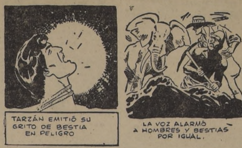
TARZAN EMITIO SU GRITO DE BESTIA EN PELIGRO