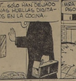
¿SÓLO HAN DEJADO UNAS HUELLAS DIGITALES EN LA COCINA?