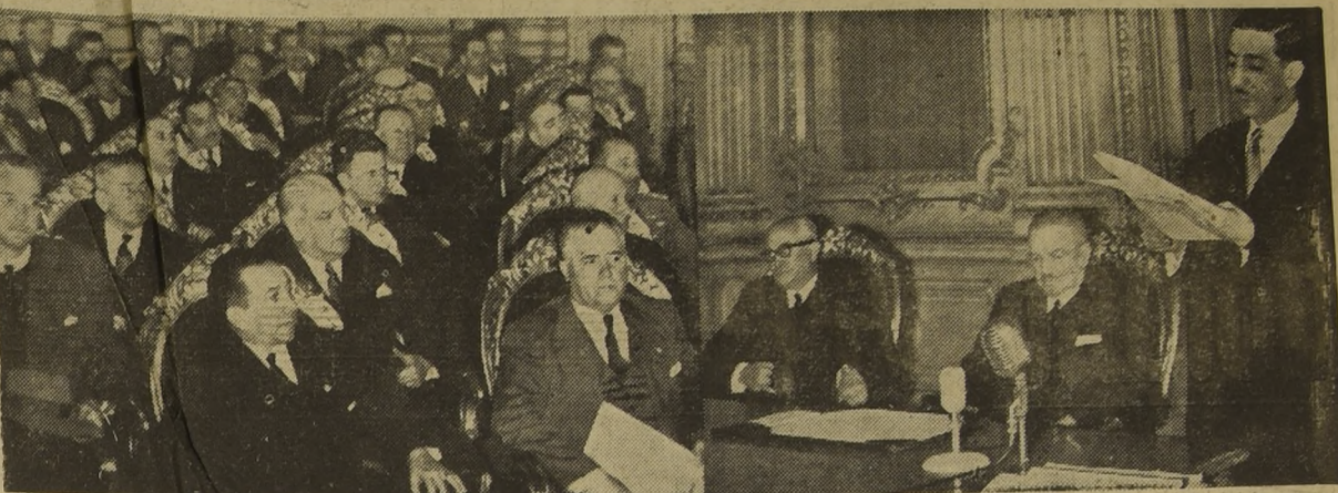
INTENDENTES ESCUCHAN MEDIDAS DEL GOBIERNO CONTRA LA ESPECULACION. — A las 10.30 horas de ayer se efectuó en el Palacio de la Moneda la reunión de los Intendentes del país, convocada por el Presidente de la República, a fin de dar a conocer las medidas que se adoptarán para combatir la especulación. Esta reunión fue presidida por el Jefe del Estado y los Ministros del Interior y de Economía, señores Ovaldo Koch y Rafael Tarud, respectivamente.

DAMOS DE TARUD. — Continúa la verificación de los puntos de control de los camiones por el Ministro Tarud.