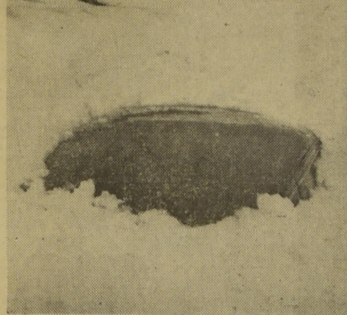
DOS METROS DE NIEVE. — Dos metros de nieve cubren el camino a Farellos en esa parte de la cordillera. El automóvil captado en la fotografía, apenas si pudo librarse de su prisión de hielo, que ya dura largos días. Trullas especiales trabajan para despejar el camino y de este modo se podrá ir en esta semana.