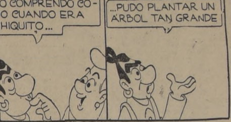
NO COMPRENDO COMO CUANDO ERA CHIQUITO... PUDO PLANTAR UN ARBOL TAN GRANDE