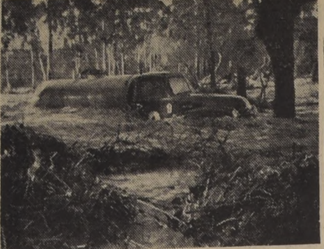
ESTRAGOS DEL TEMPORAL.—QUINTERO.—Un camión petroero ha quedado en difícil situación por la crecida de las aguas...

SOLDADURA 50% SORENA 30% PUREZAS GARANTIZADAS MAURICIO HOCHSCHILD y CIA. LTDA.