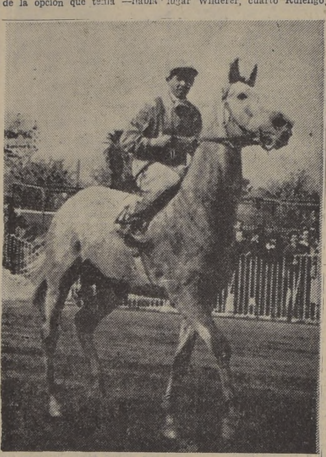
GLORIOSO, por Filibustero y Gloriana, elemento de 4 años, que obtuvo una lucida victoria en la prueba clásica de La Palma.

En los últimos lugares, Retieta y Carmelita. No hubo cambio de importancia hasta mucho después de girado, al poste de los 900 metros, donde Tres de Trébol pasó el cuarto lugar y siguió avanzando, acción que había sido iniciada por Leg Galgos, que poco antes de la curva final, dejó atrás al puntero, y entró a la recta con pequeña ventaja sobre Tres de Trébol. Ya en la tierra, cargó Glorioso sobre los nuevos líderes, y cuando Tres de Trébol rebasaba la línea de Los Galgos, cayó sobre él el favorito, luchando ambos unos cien metros, y viéndose de inmediato que era el favorito el vencedor, que en su acción en los últimos metros, el pensionista del stud "Levantino" terminó el recorrido un cuerpo antes que Tres de Trébol, que precedía a Lancero; quinto, Farieta; sexta, Retieta, que indebidamente se le descomponía bien a esta meta; séptimo, San Roque; y octava y última, Carmelita.