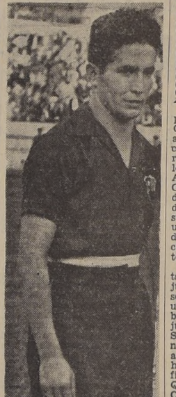
EL VASCO ZARRA, fue el centro delantero que me dio más trabajo, cuenta Arturo Fariás. Ocurrió en el Mundial de Río donde Zorra fue una de las figuras más valiosas de España. Tratando de descolocarme, se abría por ambos costados, y cuando atropellaba por el centro parecía un "Toro Muerto". En ese torneo se consagró el zaguero de Colo Colo y desde entonces es inamovible en los seleccionados chilenos.