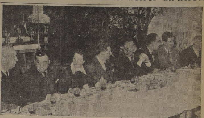
El Ministro de Obras Públicas y otras personalidades asistentes al almuerzo de ayer en "Las Salinas", en celebración del "Día del Camino".

Después de otros discursos de empleados y jefes de los servicios, y un programa folklórico, se puso término a la celebración del "Día del Camino".