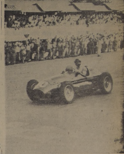
TRIUNFA FANGIO.— El crack argentino del volante, Juan Manuel Fangio, triunfa netamente en la prueba de Monza (Italia), superando al virtual campeón mundial Alberto Ascari. Fangio pilotó una máquina Maseratti 2.000.

MUEBLES DE CUERO Confortables, Chesterfield en diversos colores y estilos CAJAS de fondos de todas las medidas. Diferentes marcos. Amplias facilidades. Casa de Remates NICANOR MARTICORENA MONEDA 778