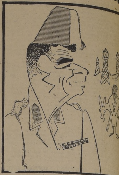
El general MOHAMED NAGUIB, Premier de Egipto, quien organizó su Gabinete dándole seis puestos claves a miembros de la Junta Revolucionaria. Se estima que con ello el Gobierno acentuará su acción nacional.