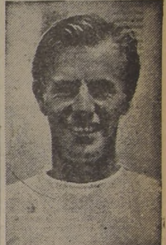
OTRA GRAN FIGURA. — Otra gran figura del tenis mundial que actuará en el Sudamericano, es Art Larsen, ex número uno del ranking de los Estados Unidos. Fue "separado" número 9, de Wimbledon, en donde actuó resentido de una pierna. Sus últimos desempesos señalan una ostensible recuperación del excelente player.