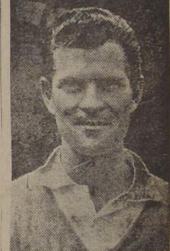
LA CAMPEON DE WIMBLEDON. — En 1950, Budge Patty ganó en Wimbledon. Este año fue uno de los "juergos duros" de ese certamen. Juego de gran calidad, potente, elegante, técnico, espectacular. Sería seguramente la máxima atracción del próximo Sudamericano que se juega en el Stade Français.