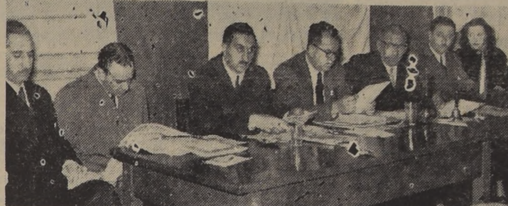
MESA DE HONOR, que ayer presidió la sesión inaugural del Consejo Nacional del Partido Agrario Laborista...