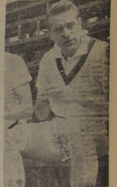
VUELVE A VISITARNOS. — Jaroslav Drohny —checo exiliado— "globe-trotter" del tenis, vuelve a Santiago. Su juego dejó una honda impresión, por lo completo de sus recursos. Pero quedó en tela de juicio el espíritu deportivo, del cual dio muchas demostraciones plausibles...

La Federación de Tenis de Chile está completando en estos momentos los detalles del campeonato sudamericano que para el 31 de este mes se han realizado hasta ahora en nuestras canchas, principalmente por la jerarquía de los extranjeros, todos figuras grandes del tenis europeo y norte y sudamericano. Vendrán Budge Patty, ex campeón de Wimbledon, Art Larsen y Harry Likas, cracks que están incluidos en los primeros lugares del ranking de Estados Unidos; el checoslovaco exiliado Jaroslav Drohny, finalista en el campeonato de Wimbledon en 1952; Sven Davidson, campeón de Suecia; Fausto Gardini y Giuseppe Merlo, frecuentes campeones de Italia; y el argentino Enrique Morea, uno de los cracks del tenis sudamericano.