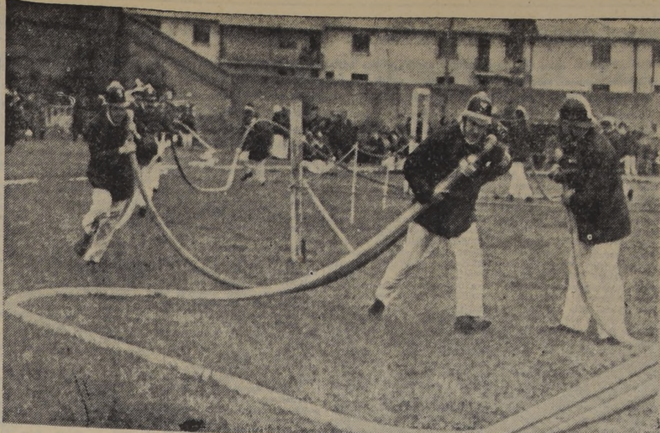
IGUAL QUE EN UN INCENDIO REAL. — Las compañías de agua tuvieron que desplegar todos sus atributos de rapidez y precisión en diferentes lugares del Estadio. Los Caballeros del Fuego—como se les llama a los bomberos—hicieron una magnífica presentación. La Quinta Compañía se adjudicó el primer premio en agua, derrotando a su tradicional rival, la "Cuarta". Los muchachos de la Quinta Compañía salieron ostentando canchales alusivos a la derrota de la cuarta. En la noche celebraron el triunfo con una fiesta en su local.

SORBE MICROONDAS DISERTARAN EN LA CLASE DE INGENIERIA El día 18 de octubre del presente, en la Sala F de la Facultad de Ingeniería de la Universidad de Chile, disertará acerca de "Experiencias con Microondas", un curso de conferencias organizado por el Centro de Investigación Científica y Tecnológica de la Universidad de Chile.