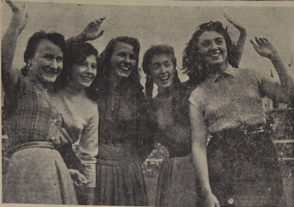
ASPIRAN AL CETRO DE LA JUVENTUD.— En el Estadio Nacional se pre-

El presupuesto de inversiones, es el primer paso hacia un mecanismo que permita organizar y planear racionalmente la intervención del Estado en el campo de la economía nacional.